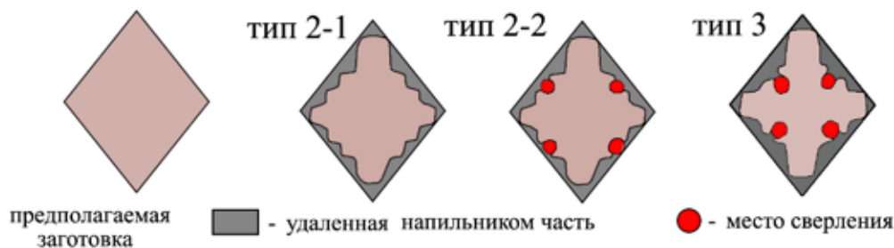
Рис. 3. Схема-реконструкция обработки янтарной заготовки под кресты типов 2 и 3