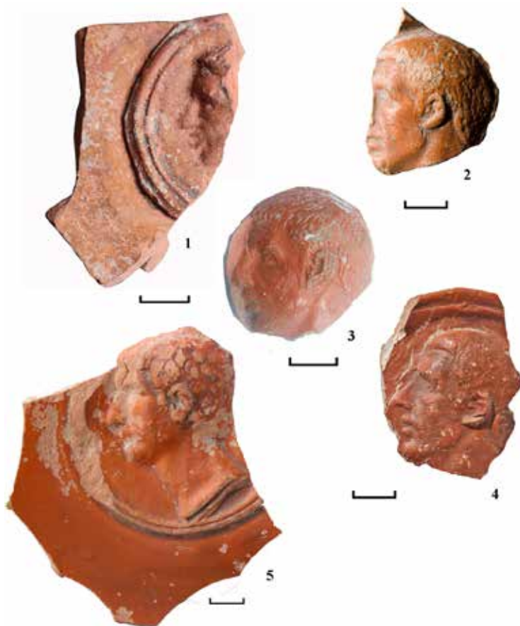
Рис. 2. Портретные медальоны с памятников Крыма: 1 – Херсонес; 2 – покупка в Керчи; 3 – Китей [по: 23, fig. 5]; 4 – Пантикапей; 5 – Алма-Кермен