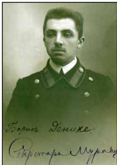
Портрет Бориса Денике в студенческие годы. Фото Бориса Денике (Государственный архив Республики Татарстан. Ф. 977. Оп. л/д. Д. 34673. Л. 22). Публикуется впервые

Историк искусства Востока Борис Петрович Денике (1885–1941) – уникальная личность. Он вырос и учился в Казани, воспитывался в русско-немецкой семье. Поликультурность и полиэтничность городской среды, окружавшей мальчика в детстве и молодости, не могли не повлиять на возникновение у него раннего интереса к Востоку [21, с. 25]. Уже в 9–10 лет «Боба», как его звали в семье, начал изучать арабский язык [21, с. 32–33], мечтал о поступлении в Лазаревский институт восточных языков в Москве [28, с. 136]. По собственной инициативе Б. П. Денике продолжил изучать арабский язык в Императорском Казанском университете. Он записался на курс арабского языка к известному профессору-востоковеду Н. Ф. Катанову (Государственный архив Республики Татарстан. Ф. 977. Оп. л/д. Д. 3473. Л. 12 об.).