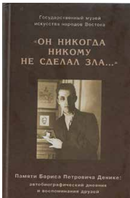
Фото Б. П. Денике (портрет). Обложка книги «Он никогда никому не сделал зла...» (Памяти Бориса Петровича Денике: автобиографический дневник и воспоминания друзей). М.: Государственный музей искусства народов Востока, 2006

Теоретические знания Б. П. Денике и приобретенные навыки по методике искусствоведческого анализа позволили ему самостоятельно провести типологические обобщения и показать специфику и значение архитектурного наследия крымских татар. Б. П. Денике выявил несколько архитектурных стилей, повлиявших на облик крымско-татарских построек, сочетавших в себе традиции зодчества не только арабского Востока, но и Кавказа, Турции, Византии и даже Западной Европы – Ренессанса и Рококо. Неповторимый облик сооружений «культовой» и «гражданской» архитектуры крымских татар сформировался, по мнению Б. П. Денике, благодаря синтезу многих стилей. Уникальность памятникам придавали резные надписи и немногочисленные восточные орнаментальные мотивы.