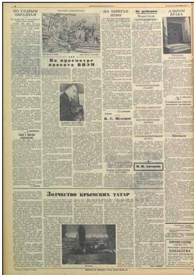
Фото статьи из газеты 1937 года