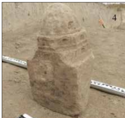
Рис. 2. Надгробие дюрбеобразно-медресевидной формы [по: 7, с. 60, рис. 2,4]