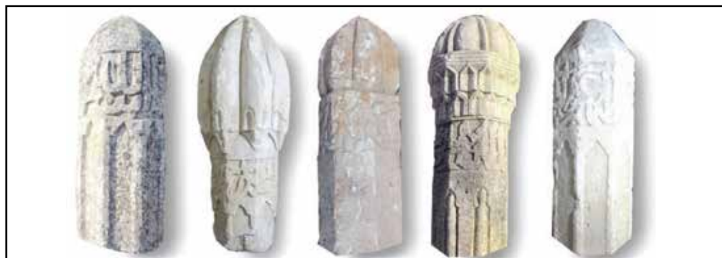
Рис. 3. Типология надгробий подтипа «баш-таш» («дюрбеобразные») по М. А. Усеинову [по: 11, с. 131, рис. 1]