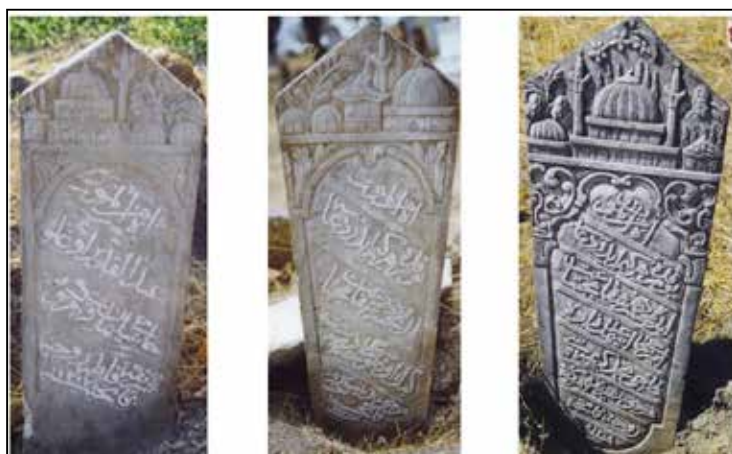
Рис. 4. Надгробия Гёрдеша с изображением медресе [по: 16, р. 1738]