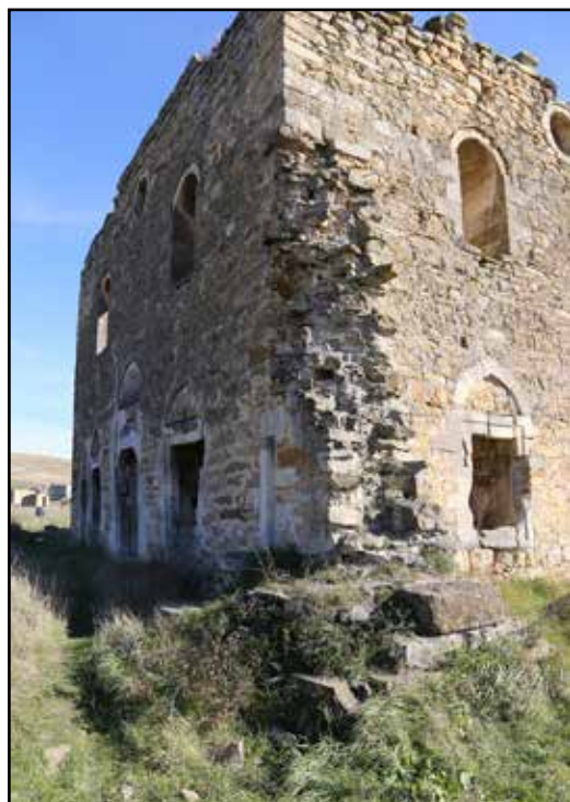
Рис. 10. Мечеть Эски-Джами. Примыкание минарета к северо-западному углу мечети. 2018 г.