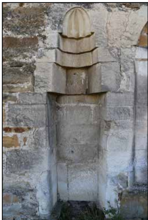
Рис. 14. Мечеть Эски-Джами. Внешняя молитвенная ниша на северной стене мечети. Вид с севера. Фотоснимок Д. А. Ломакина. 2018 г.