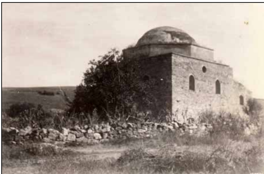
Рис. 3. Мечеть Эски-Джами до разрушения купола. Вид с юго-запада. Фотоснимок 1920-х гг.