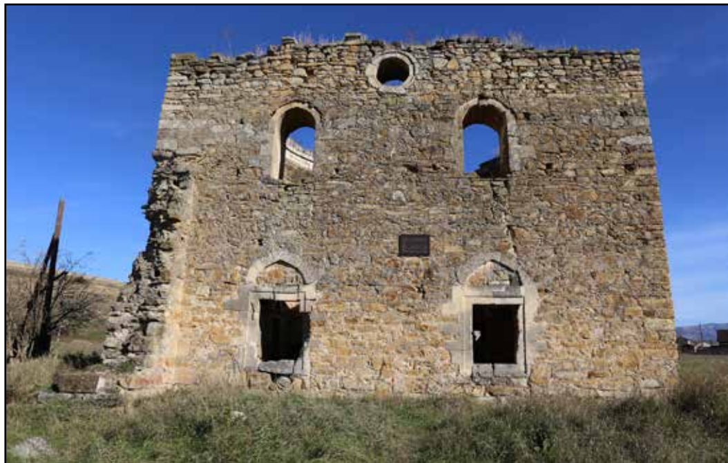
Рис. 9. Мечеть Эски-Джами. Вид с запада. 2018 г.