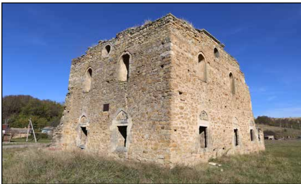
Рис. 8. Мечеть Эски-Джами. Вид с юго-запада. 2018 г.