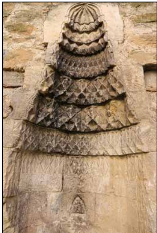
Рис. 13. Мечеть Эски-Джами. Конха михраба. Вид с севера. 2018 г.