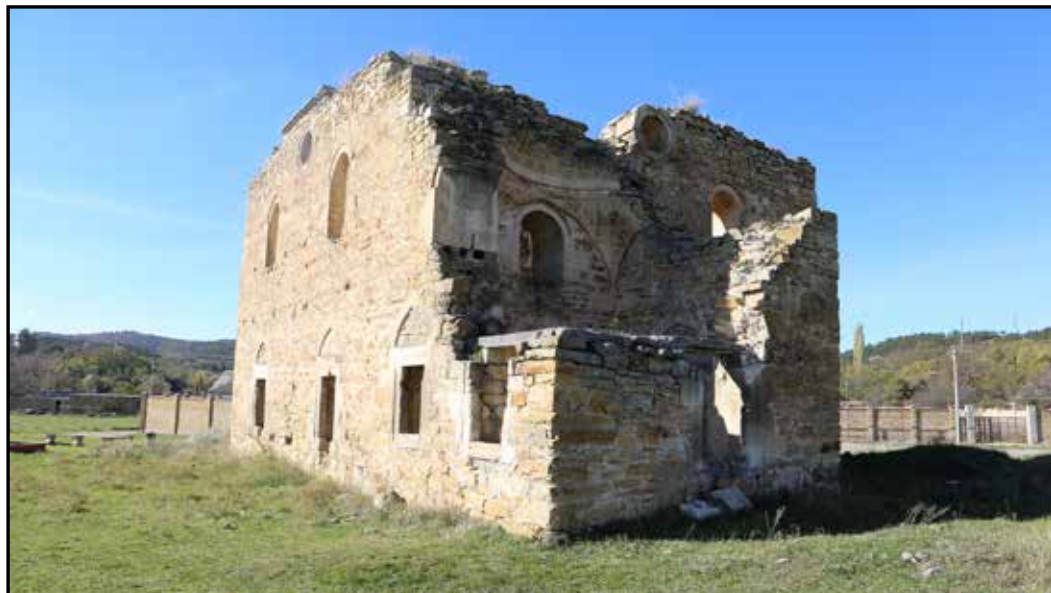
Рис. 7. Мечеть Эски-Джами. Вид с юго-востока. 2018 г.