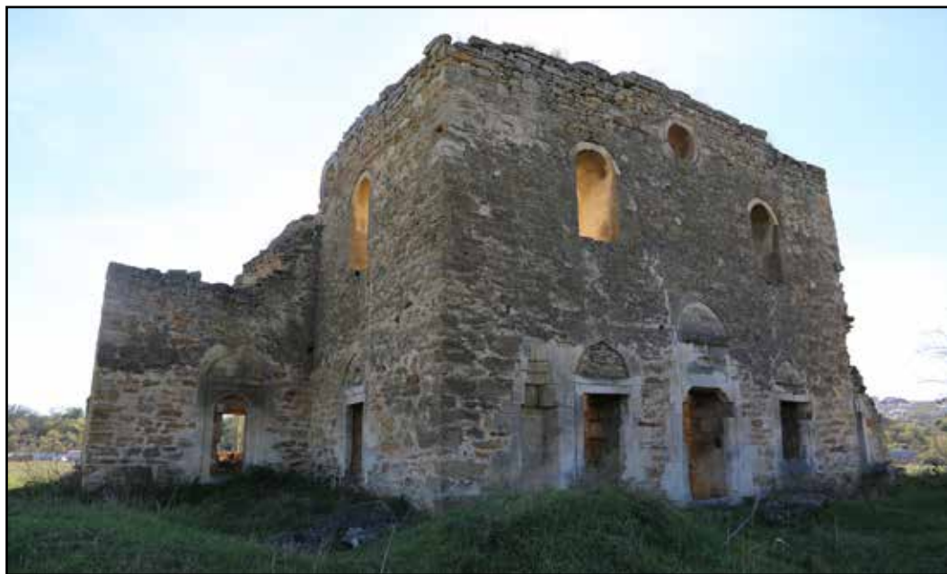
Рис. 6. Мечеть Эски-Джами. Вид с северо-востока. 2018 г.

Fig. 5. The vaulting of Eski-Dzhami mosque. 1950