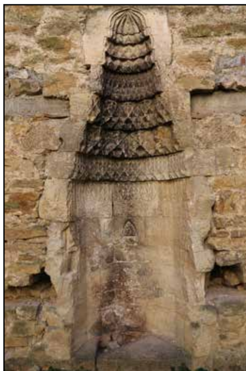
Рис. 12. Мечеть Эски-Джами. Михраб основного помещения мечети. Вид с севера. 2018 г.