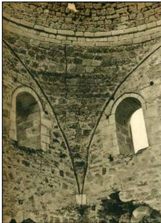
Рис. 5. Свод мечети Эски-Джами. 1950 г.

Fig. 5. The vaulting of Eski-Dzhami mosque. 1950