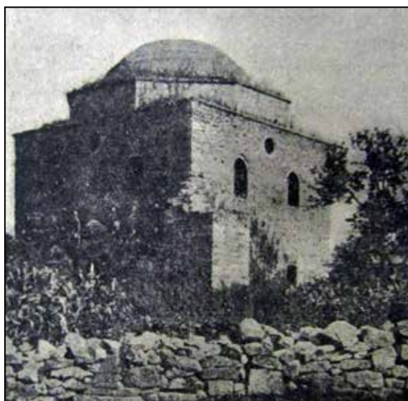
Рис. 2. Мечеть Эски-Джами. Вид с северо-запада. Фотоснимок 1923 г. [25, с. 28]