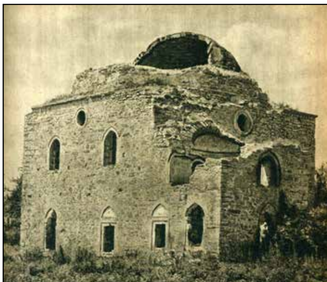
Рис. 4. Мечеть Эски-Джами. Вид с юго-востока. 1950 г.