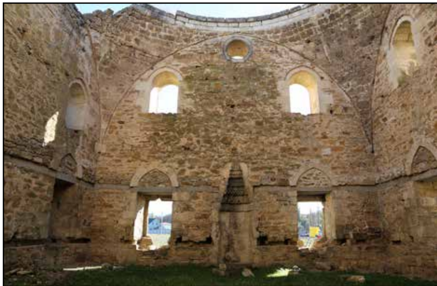
Рис. 11. Мечеть Эски-Джами. Внутреннее пространство мечети. Вид с севера. 2018 г.