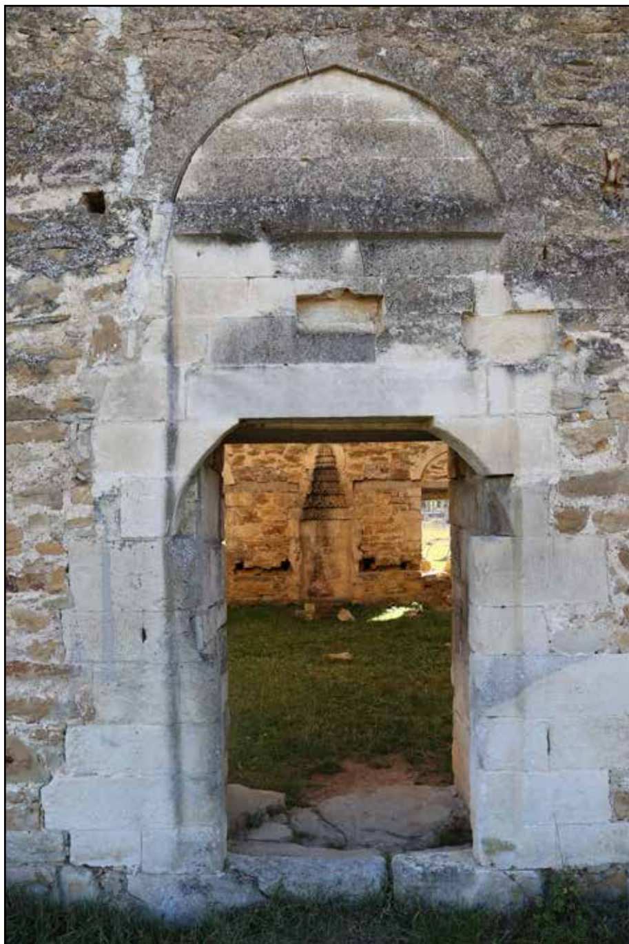
Рис. 15. Мечеть Эски-Джами. Портал основного помещения мечети. Вид с севера. 2018 г.