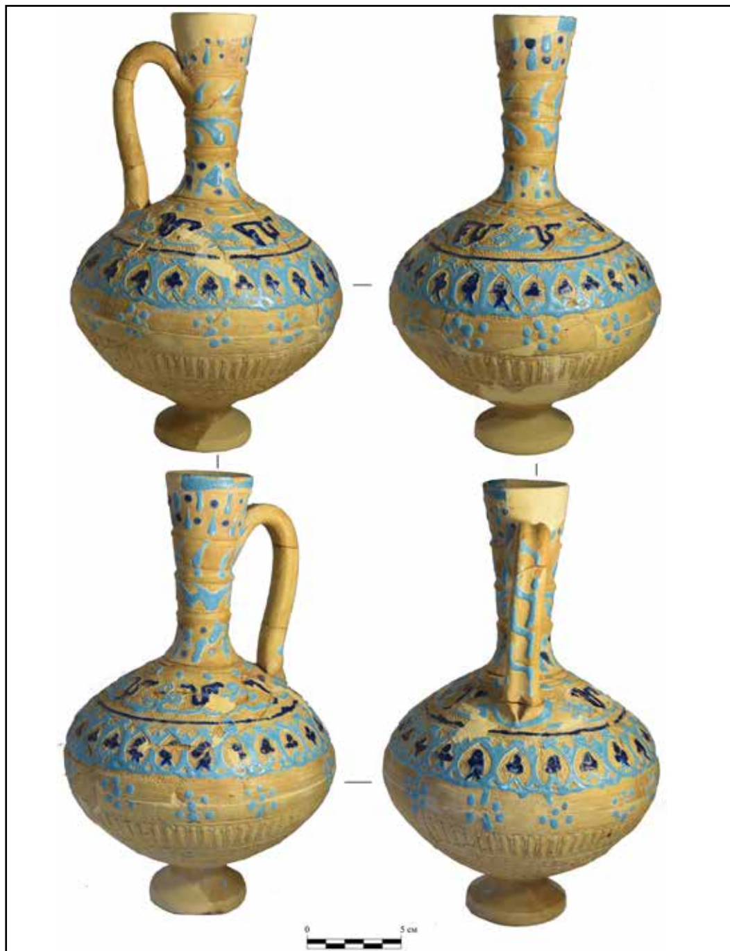
Рис. 1. Штампованный кувшин с бирюзовой глазурью из Солхата из раскопок в Георгиевской балке