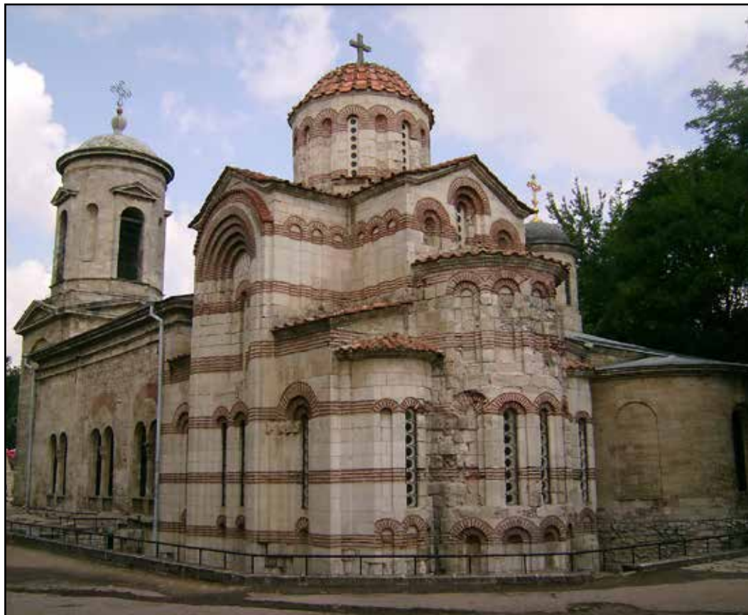
Рис. 7. Храм Иоанна Предтечи в Керчи, вид с юго-востока