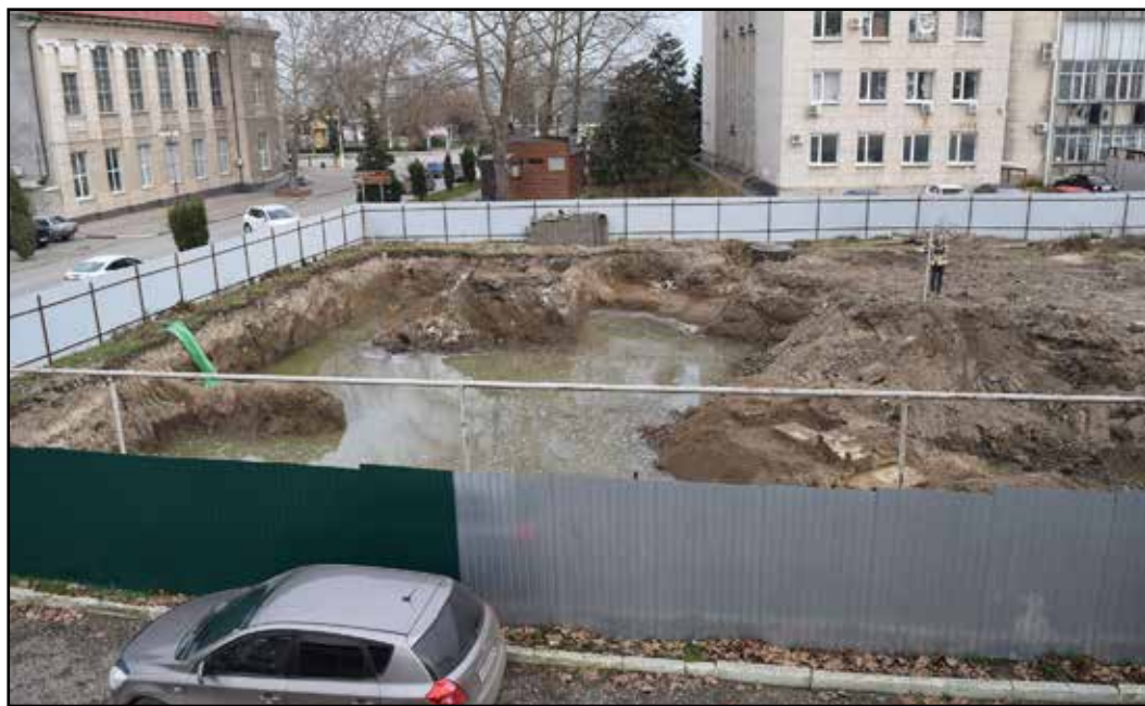
Рис. 6. Строительный котлован с крепостной стеной на ул. Советской. Фото 2019 г.