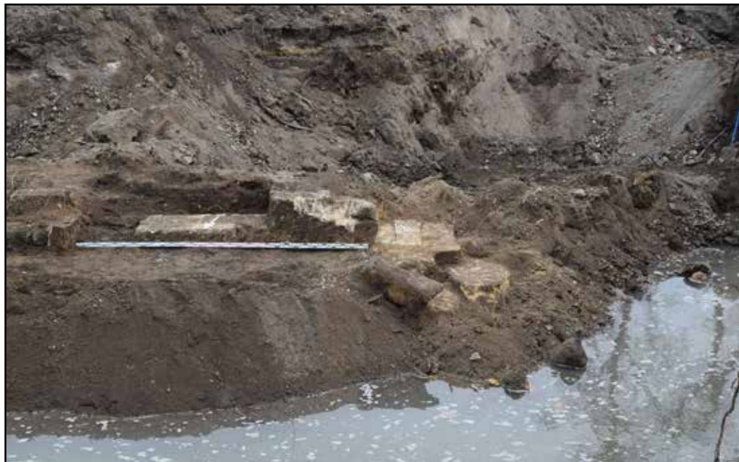
Рис. 5. Крепостная стена на ул. Советской, вид с севера. Фото 2019 г.