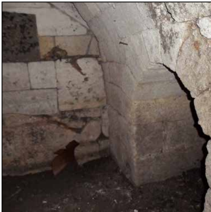
Рис. 3. Участок стены Юстиниана на ул. Театральной Fig. 3. The section of Justinian's wall on Teatral'naia Street