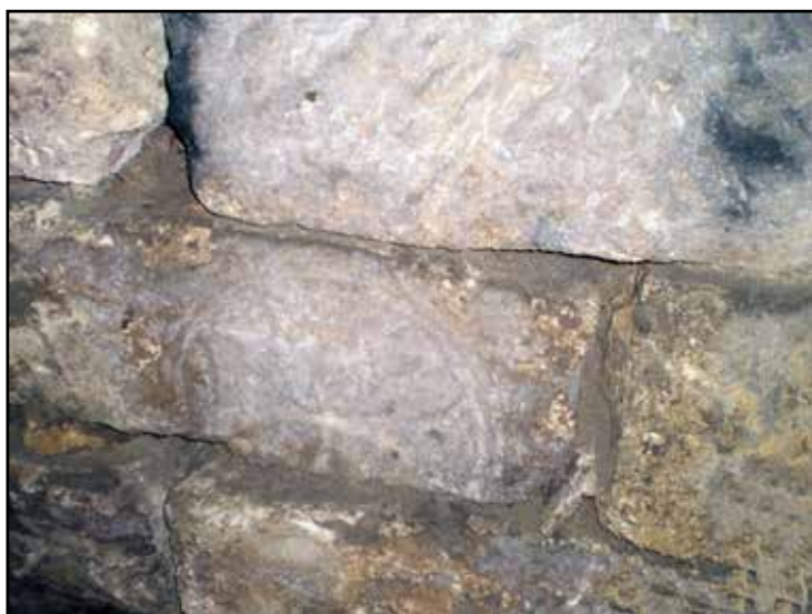
Рис. 4. Изображение креста на блоке в стене на ул. Театральной Fig. 4. Image of a cross on an ashlar in a wall on Teatral'naia Street