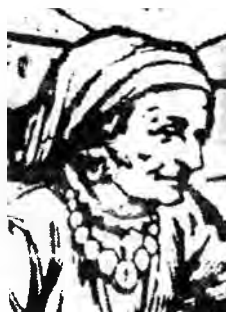
Рис.12. Изображение старушки крымчачки. 1928 г. Крупным планом изображение нагрудного украшения.