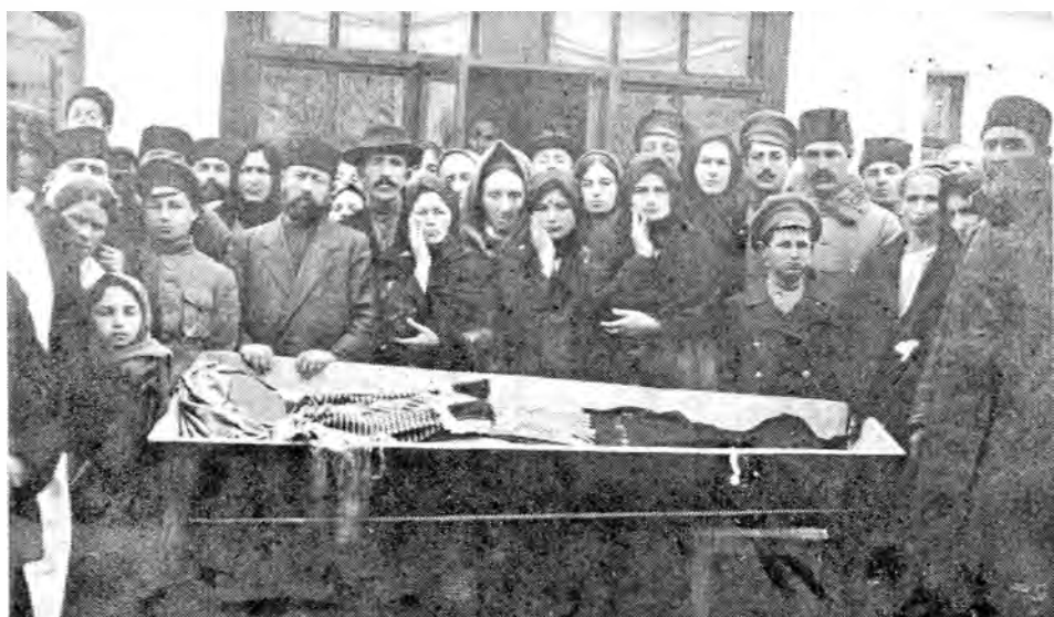
Рис.5. Похороны пожилой крымчачки в г.Феодосии во втором десятилетии XX в.