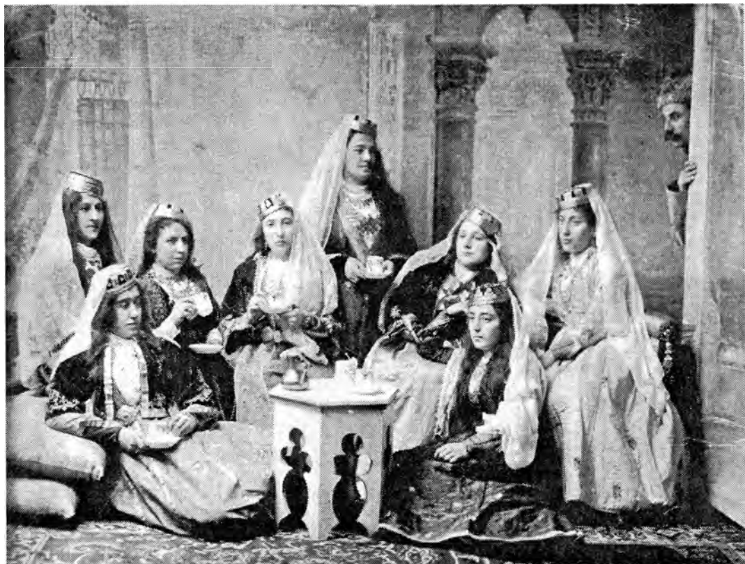
Рис.1. Сценка “Къызлар кечесы” – девичника из спектакля, поставленного драмсекцией крымчакского клуба г.Симферополя по самодеятельной пьесе крымчакского автора.