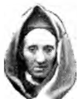
Рис.9. Головной убор "Баш багы" на пожилой женщине. С фотографии похорон феодосийской крымчачки. Частичное восстановление-реконструкция правой нижней части автором.