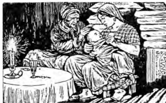
Рис.13. Изображения молодых замужних женщин крымчачек в иллюстрациях к учебнику И.С.Кая для крымчакских школ 1930 г.