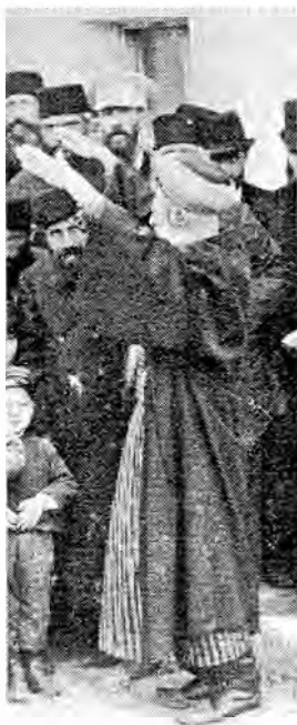
Рис.6. Одежда хахама крымчаков. Карасубазар. 1899 г.