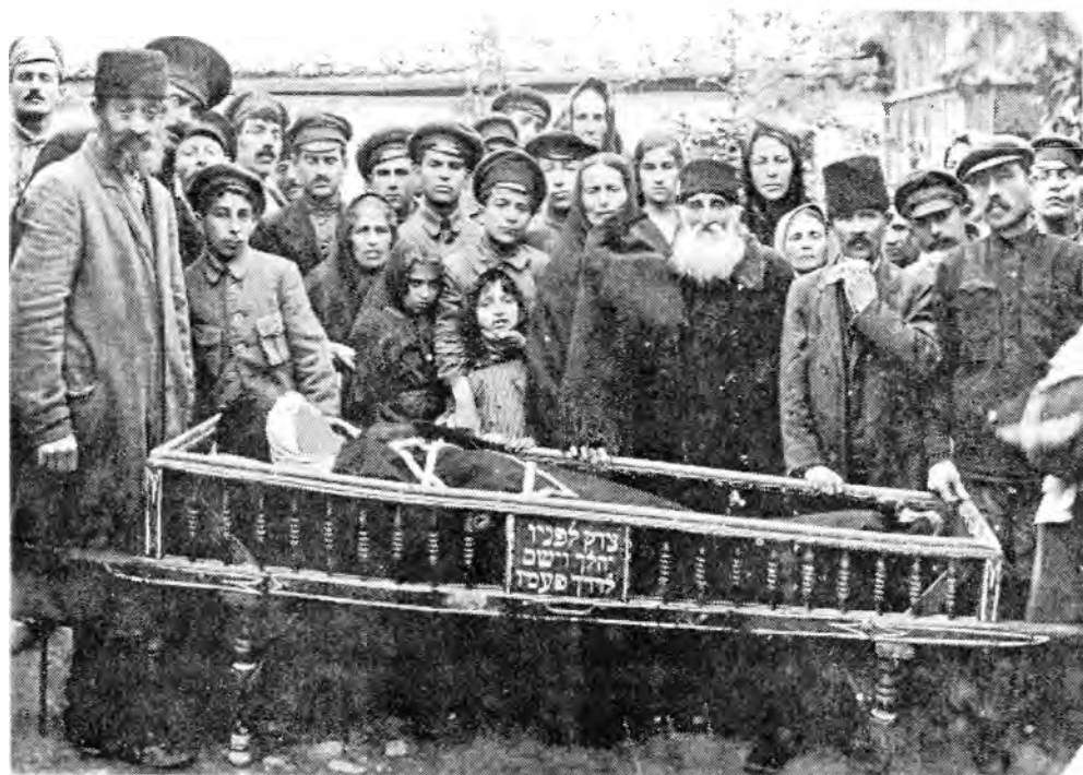
Рис.4. Похороны пожилого крымчака в г.Феодосии во втором десятилетии XX в.