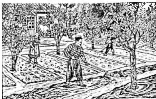
Рис.14. Изображение мужчины крымчака в иллюстрациях к учебнику И.С.Кая для крымчакских школ 1930 г.