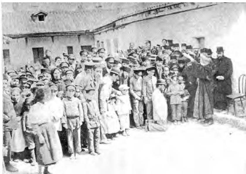
Рис.10. Х.Х.Медини благославляет учеников. Карасубазар. 1899 г.