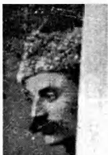
Рис.2. Головной убор, надетый на молодом мужчине (вероятно, женихе), подглядывающем за сценой девичника.