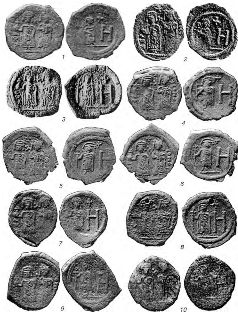
Табл. IX. Анонимные монеты Херсона времени Ираклия со знаком стоимости Н (вып. 2) и боспорская надчеканка с монограммой из начальных букв имени Ираклия на одной из них (10).