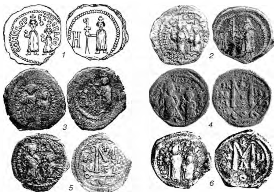
Рис. 2. 1 – рисунок монеты бывшего музея Императорского Одесского общества истории и древностей (по Н.Мурзакевичу); 2 – монета коллекции Археологического института в Бухаресте (картотека В.Хана); 3 – монета Ираклия со знаком стоимости Н из коллекции Берка (картотека В.Хана); 4-5 – фоллисы Ираклия константинопольской чеканки 3-го года правления; 6 - тип фоллиса Ираклия константинопольской чеканки 3-6 годов.

А.В.Орешников, как и в отношении монет Маврикия Тиберия без названия города, остерегался причисления монет с именами Ираклия и Ираклия Константина к продукции Херсона, мотивируя отсутствием находок этих монет на городище Херсона 90 . И.И.Толстой относил экземпляр подобной монеты из своей коллекции к херсонской чеканке, оговаривая замечание А.В.Орешникова 91 . В принадлежности монет Ираклия и Ираклия Константина Херсону не сомневался и Ф.Гриерсон при публикации экземпляра коллекции Дамбертон Окс 92 . Той же атрибуции придерживался В.А.Анохин 93 . К херсонской чеканке относил их и В.Хан, которому были известны 13 экземпляров подобных монет 94 . И.В.Соколова также не сомневалась в принадлежности монет с именами Ираклия и Ираклия Константина херсонской чеканке, апеллируя к находке одного экземпляра такой монеты в Херсонесе в 1940 г. 95 Ее не смутила находка в Керчи в 1963-1964 гг. трех подобных монет 96 , которая, по ее мнению, каким-то образом также подтверждала принадлежность монет чеканке