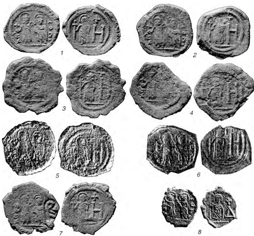
Табл.VIII. Анонимные монеты Херсона времени Ираклия со знаками стоимости Н и Δ (вып.1) и боспорские надчеканки с монограммой из начальных букв имени Ираклия на одной из монет старшего номинала (7).