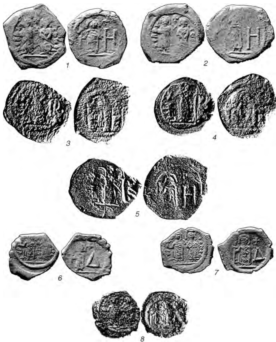
Табл. XI. Анонимные монеты Херсона времени Ираклия со знаками стоимости Н и Δ (вып.4) и боспорские надчеканки с монограммой из начальных букв имени Ираклия на них (3-5).