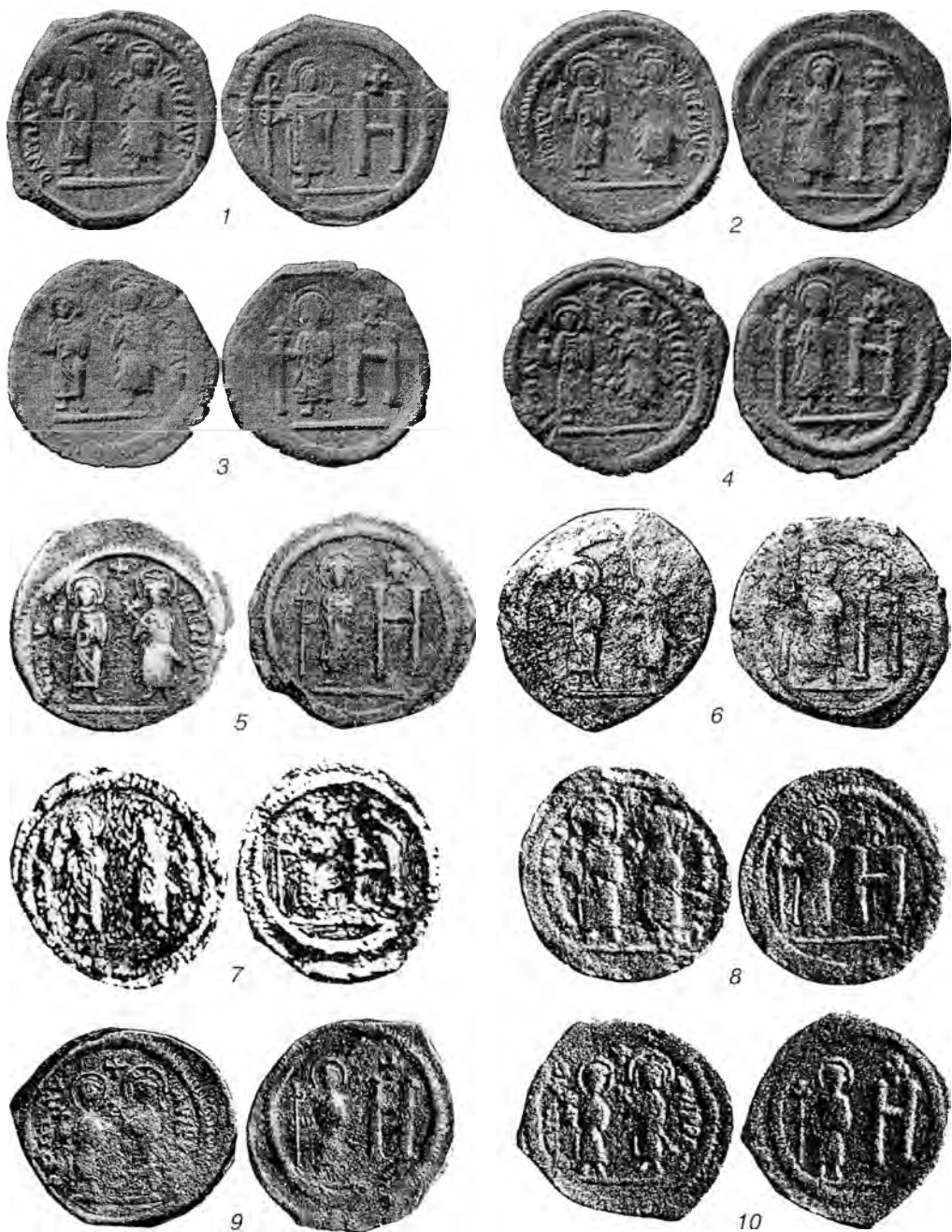
Табл. II. Боспорские монеты Маврикия Тиберия со знаком стоимости Н.