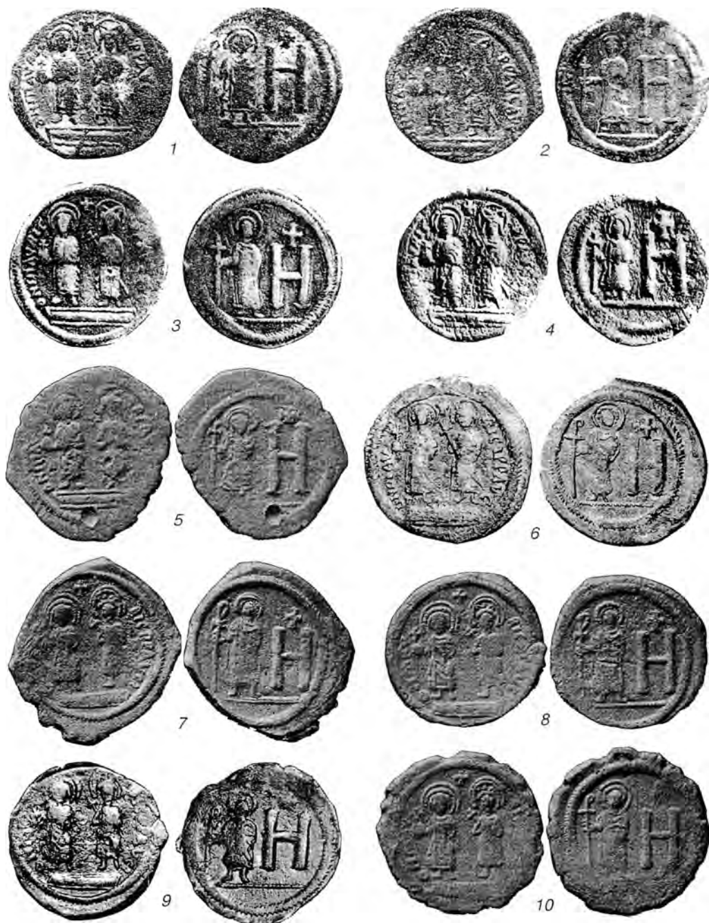
Табл. IV. Боспорские монеты Маврикия Тиберия со знаком стоимости Н.