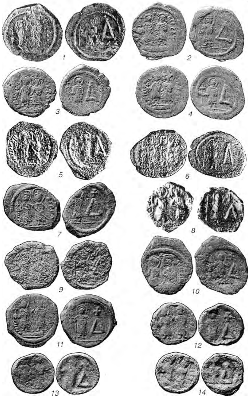
Табл. I. Боспорские монеты Маврикия Тиберия со знаком стоимости Δ (1-11) и литые копии боспорских монет, найденные в окрестностях Керчи (12-14).