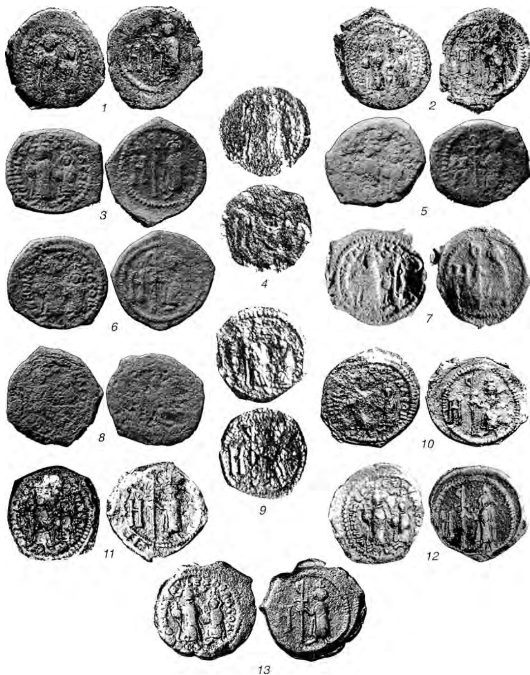
Табл.VI. Боспорские монеты Ираклия и Ираклия Константина.