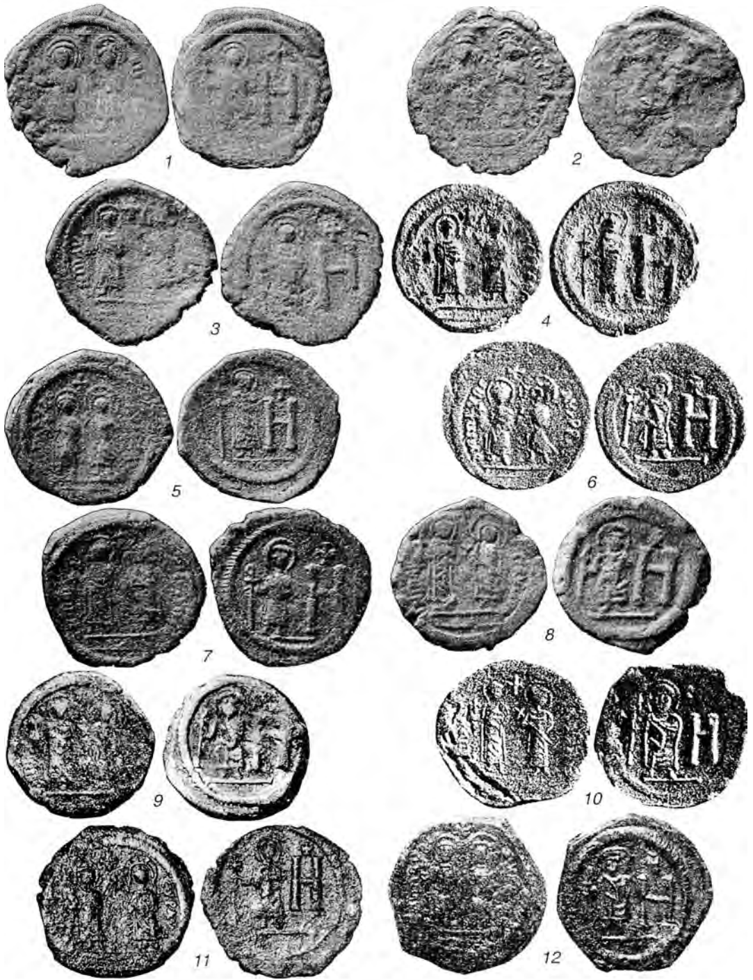
Табл.V. Боспорские монеты Маврикия Тиберия со знаком стоимости Н.