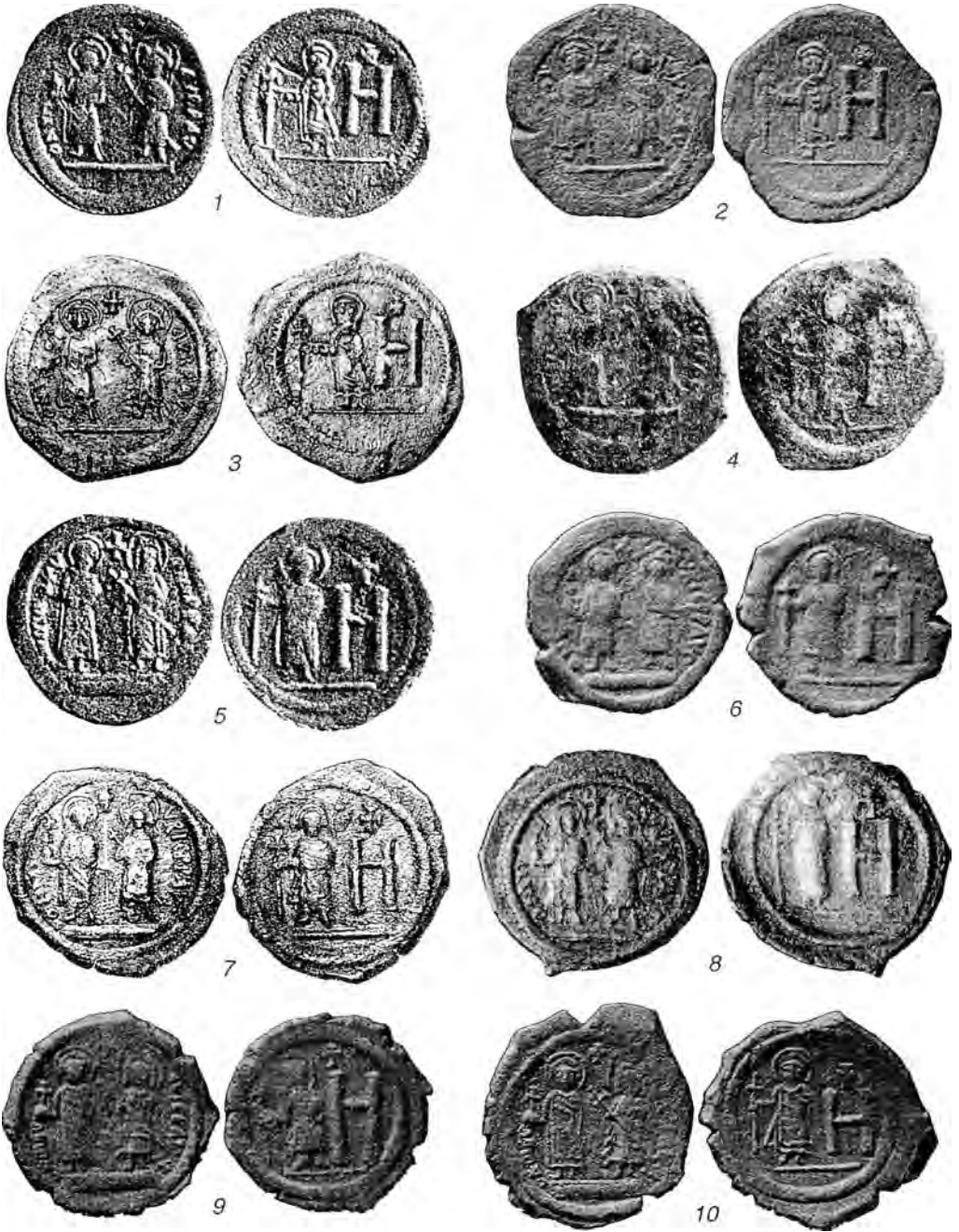
Табл. III. Боспорские монеты Маврикия Тиберия со знаком стоимости Н.