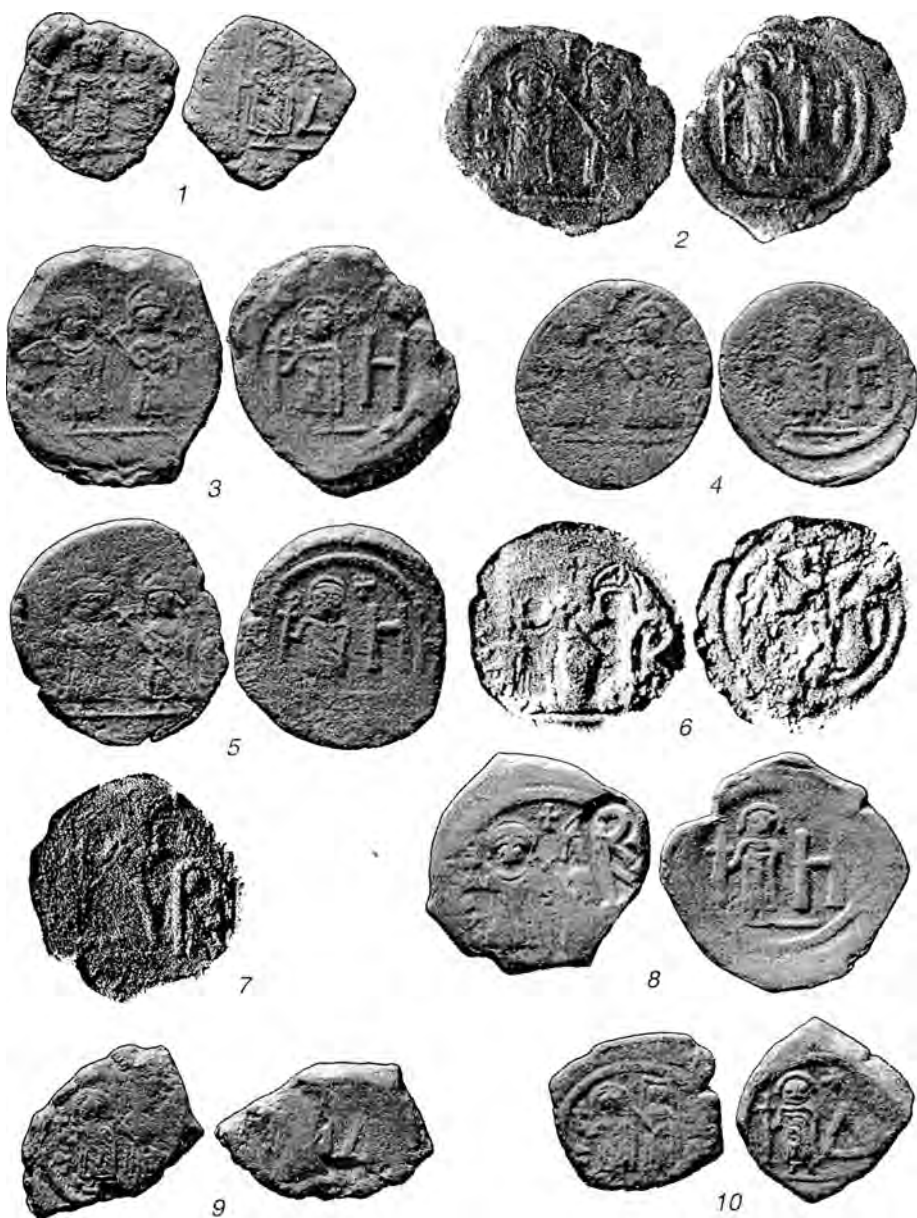
Табл. X. Анонимные монеты Херсона времени Ираклия со знаками стоимости Н и Δ (1 – вып. 2, 2-10 – вып. 3) и боспорские надчеканки с монограммой из начальных букв имени Ираклия на монетах старшего номинала (6-8)