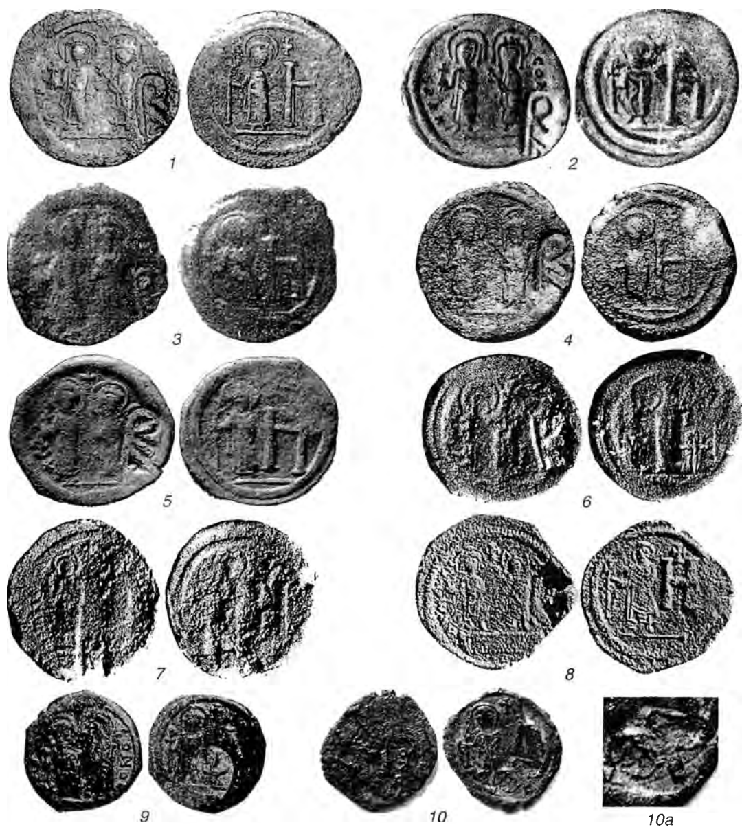
Табл.VII. Боспорские надчеканки на анонимных монетах Херсона времени Маврикия Тиберия (1-6, 9-10) и на боспорских монетах Маврикия Тиберия (7-8).