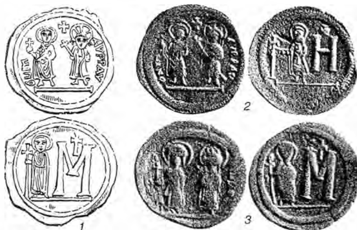
Рис. 1. 1 – опубликованный Ж.Сабатье рисунок монеты; 2-3 – монеты эрмитажного собрания, стороны которых соединены в рисунке Ж.Сабатье.