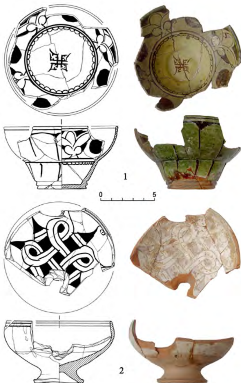
Рис. 14. Изделия со сложным врезным орнаментом, выполненным в выемчатой и сграффито технике («EIW»). 1 – группа 1; 2 – группа 2. Рисунок автора и С. В. Семина.

Э. И. СЕЙДАЛИЕВ а) , Д. Э. СЕЙДАЛИЕВА б)