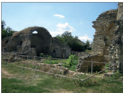
Рис. 8. Южный айван медресе, г. Старый Крым, 2016 г.