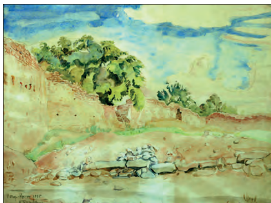
Рис. 20. К. Ф. Богаевский «Раскопки в Старом Крыму» (Караван-сарай). Бумага, акварель. 35x46,5. БИКАМЗ, к.п. 1632, инв. № 35

ский вид памятника с видом раскопанной кладки. Колорит работы высветленный, передающий яркость летнего южного утра.