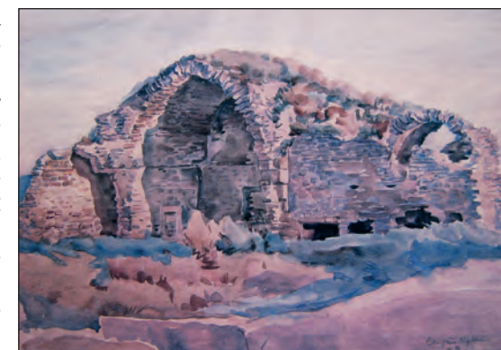
Рис. 14. К. Ф. Богаевский. «Старый Крым. Развалины медресе, 1928 г.» Бумага, акварель. 36,7x46,1. ФКГА

Как указывалось, вышеописанная акварель датирована издателем альбома 1928-м годом [19, с. 29]. В то же время, очевидно, что все работы с видами мечети Узбека и медресе Инджи-бек Хатун были выполнены К. Ф. Богаевским единолично, так как представляют собой единый тематический и художественно-живописный цикл. Обращает на себя внимание отмеченная выше особенность: все акварели, включая и последнюю, не отражают результатов исследования этих памятников, впрочем, на так называемой акварели 1928 г. археологические раскопы не могли быть показаны из-за высокой точки обзора. Это приводит к выводу о не совсем корректной датировке акварели 1928 годом. Вполне оправдана дата этих работ 1920-ми годами, то есть К. Ф. Богаевский выполнил акварели в период, предшествовавший началу раскопок комплекса мечеть-медресе.