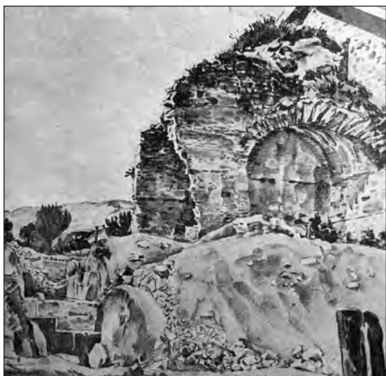
Рис. 17. К. Ф. Богаевский. «Раскопки медресе». 1925 г. [4, с. 26]

ные блоки нижнего ряда кладок помещений восточной и западной стен медресе (вид с востока).