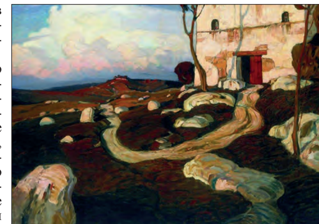
Рис. 1. Богаевский К. Ф. «Старый Крым». 1902 г. Холст, масло. 101x136,5. Государственный Русский музей, инв. № Ж-2341

В 1903 г. была написана работа «Последние лучи» (рис. 3). Как отмечает В. Манин, это полотно едва ли не самое «красочное» в творчестве художника [17, с. 10]. К описанию В. Манина можно добавить одно наблюдение, позволяющее, с большой долей вероятности, эту работу также отнести к старокрымским. Та точка