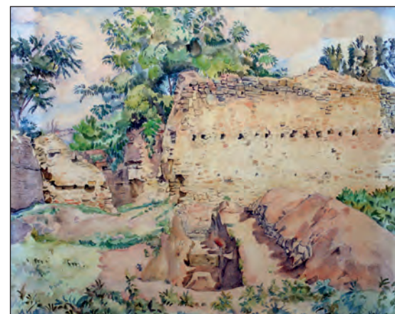
Рис. 19. К. Ф. Богаевский «Раскопки в Старом Крыму» (Караван-сарай). Бумага, акварель. 37х46. БИКАМЗ, к.п. 1630, инв. № 33

« Раскопки в Старом Крыму. Акварель » (рис. 20). На фоне западной,