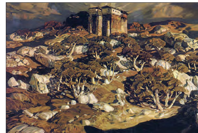
Рис. 2. Богаевский К. Ф. «Старый Крым». 1903 г. Холст, масло. 110x160. Саратовский художественный музей им. А. Н. Радищева, инв. № Ж-2240