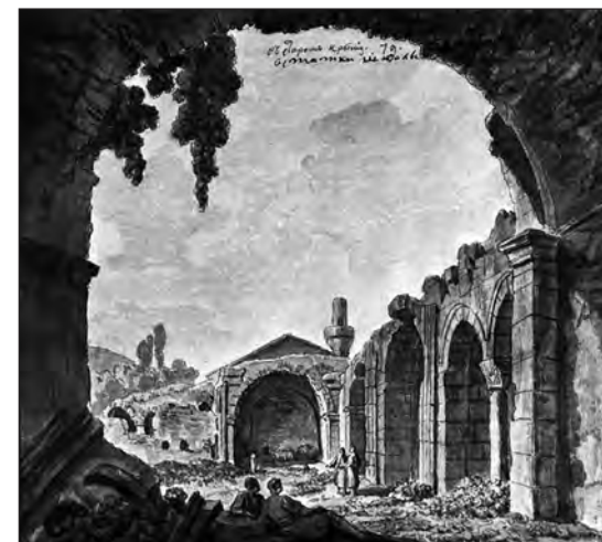
Рис. 9. М. М. Иванов. «В Старом Крыму. Остатки школы». 1783 г. Акварель. Внутренний двор медресе. Вид с юга. Государственный Русский музей, г. Санкт-Петербург, № Р-30073

арматурного каркаса с кровлей над помещениями комплекса, укреплению кладки сводчатых перекрытий и худжр. Продолжаются работы по археологическому исследованию наслоений внутри помещений северной и южной сторон. Археологические работы проводятся Старокрымской экспедицией Государственного Эрмитажа, руководитель М. Г. Крамаровский.