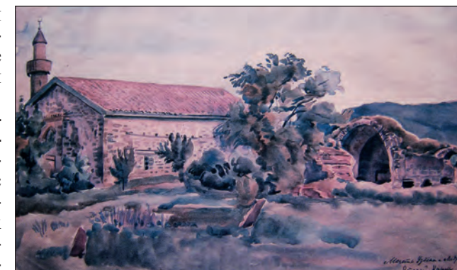
Рис. 4. К. Ф. Богаевский. «Мечеть Узбека и медресе в Старом Крыму», 1926 г. Бумага, акварель. 28,1x47,6. ФКГА