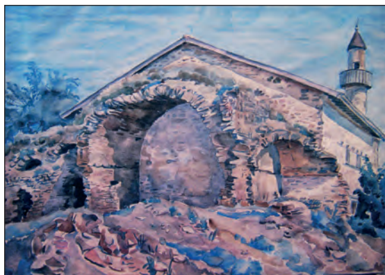
Рис. 13. К. Ф. Богаевский. «Руины медресе и мечеть Узбека в Старом Крыму», 20-е гг. XX в. Бумага, акварель. 37,2x47,4. ФКГА

Пейзаж передает спокойное послеполуденное состояние природы, постройки составляют неотъемлемую часть пейзажа. Акварель написана с точки обзора, с которой археологические раскопы не могут быть видны. Акварели мечети и медресе (рис. 4, 12, 13), на которых отсутствуют раскопы, отражают первоначальное состояние памятника. Акварели с изображением медресе являются скорее пейзажами с романтическими руинами, нежели технической работой.