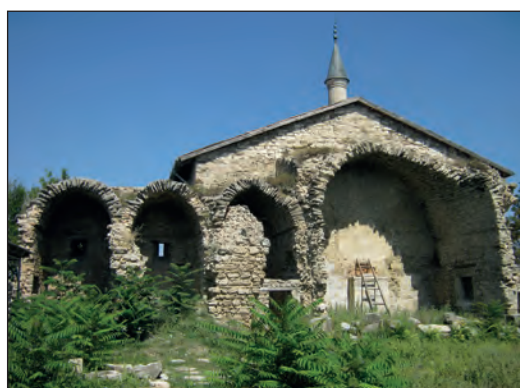
Рис. 7. Северный айван и худжры медресе, г. Старый Крым, 2016 г.