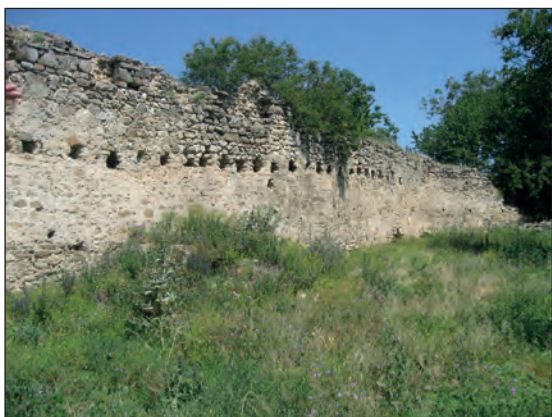
Рис. 18. Северо-западная и часть северо-восточной стены Караван-сарая, вид с юга, г. Старый Крым, 2016 г.

Как указывалось выше, в 1925-26 гг. раскопки проводились на территории караван-сарая, такое определение этот объект получил именно в результате источниковедческого и археологического изучения Старокрымской экспедиции. Внимание археологов было привлечено сохранившимися большими фрагментами стен, оказавшимися в плане пятиугольной постройкой площадью 2500 м 2 , имеющей глухие