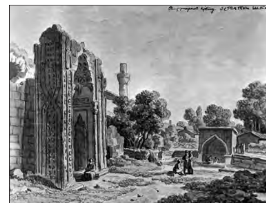
Рис. 10. М. М. Иванов. «В Старом Крыму. Остатки школы». 1783 г. Акварель. Портал медресе. Вид с юго-востока. Государственный Русский музей, г. Санкт-Петербург, № Р-30072