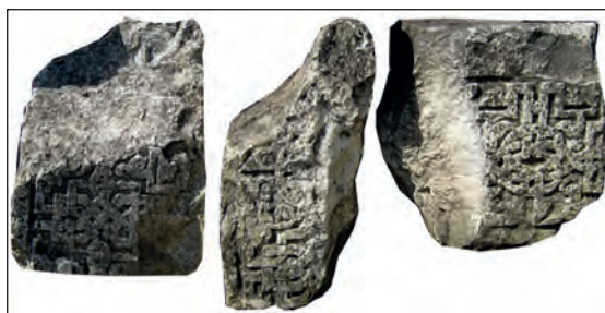
Рис. 11. Фрагменты резного архитектурного декора из медресе, г. Старый Крым, 2016 г.