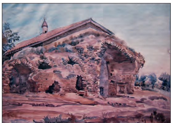
Рис. 12. К. Ф. Богаевский. «Старый Крым. Руины медресе, 20-е гг. XX в.» Бумага, акварель. 37x47,4. ФКГА