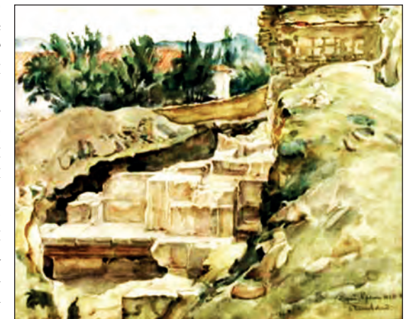
Рис. 16. К. Ф. Богаевский «Раскопки в Старом Крыму» (медресе, портал). Бумага, акварель. 37x47. БИКАМЗ, к.п. 1600, инв. № 3