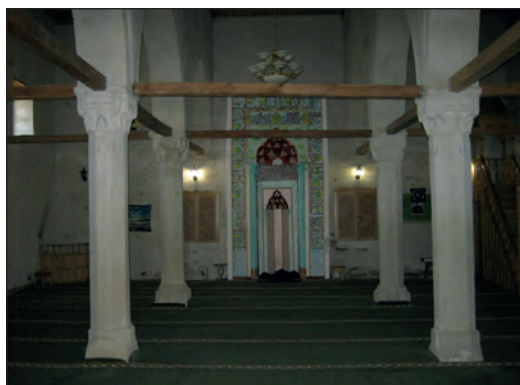
Рис. 6. Внутреннее пространство мечети Узбека, г. Старый Крым, 2016 г.