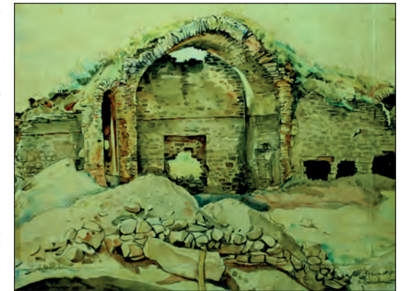
Рис. 15. К. Ф. Богаевский «Раскопки в Старом Крыму» (медресе, южный айван). Бумага, акварель. 37,5x45,3. БИКАМЗ, к.п. 1631, инв. № 34

« Раскопки в Старом Крыму. Акварель » (рис. 16) является изображением восточной порталной стены медресе в раскопанном состоянии [БИКАМЗ, к. п. 1600, инв. № 3; 15, с. 35]. На переднем плане видны фундамент и нижние ряды профилированной кладки основания северного пилона монументального портала, сложенных из больших отесанных известняковых плит и квадров. Траншея окружена земляным отвалом, кладка восточной стены с порталом была раскопана до юго-восточного угла здания медресе