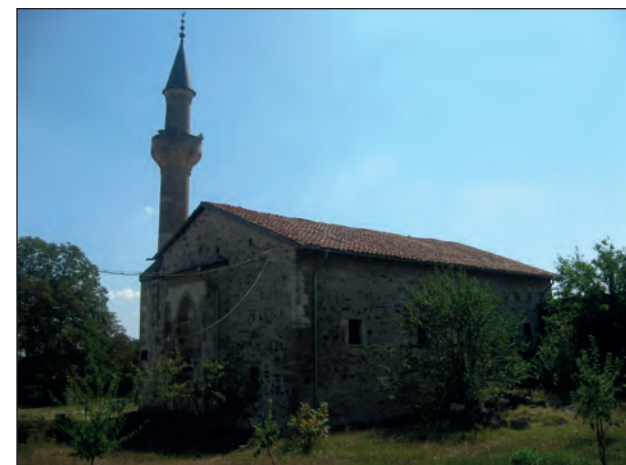
Рис. 5. Мечеть Узбека, г. Старый Крым, 2016 г.