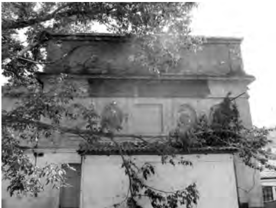
Рис. 5. Караимская кенаса в Бахчисарае (ул. Ленина, 67). Современное состояние.