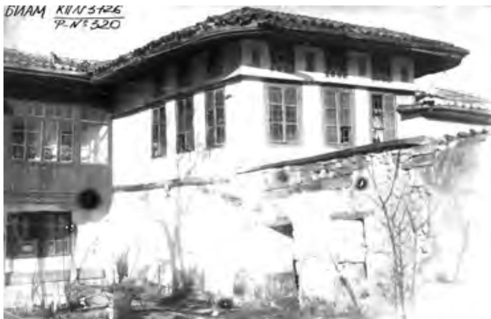
Рис. 2. Бахчисарай. Дом купца Ходжаша Борю.