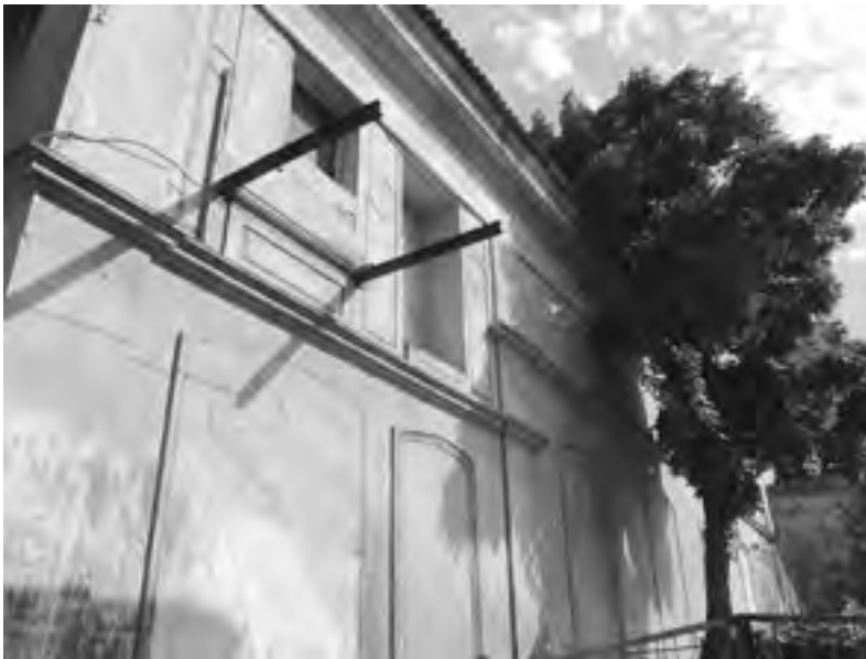
Рис. 4. Караимская кенаса в Бахчисарае (ул. Ленина, 67). Современное состояние.