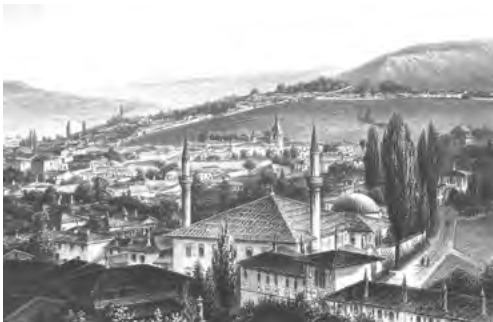
Рис. 1. Вид на Бахчисарай. С гравюры Э. Бердта (1869 г.).