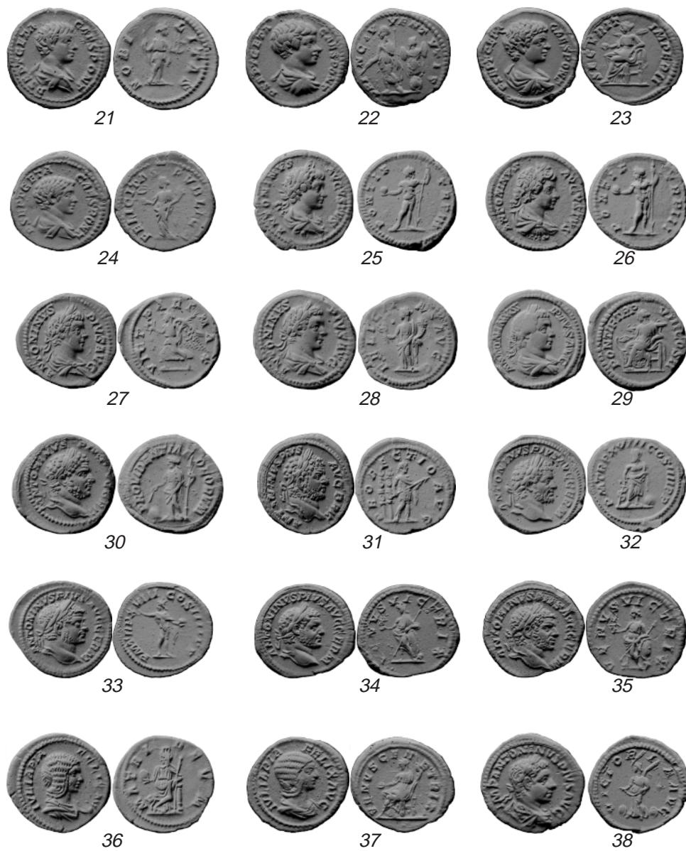
Табл. II. Серебряные денарии клада у с. Репино: 21-29 - Геты (цезаря); 30-33 - Каракаллы; 34-38 - Элагабала.