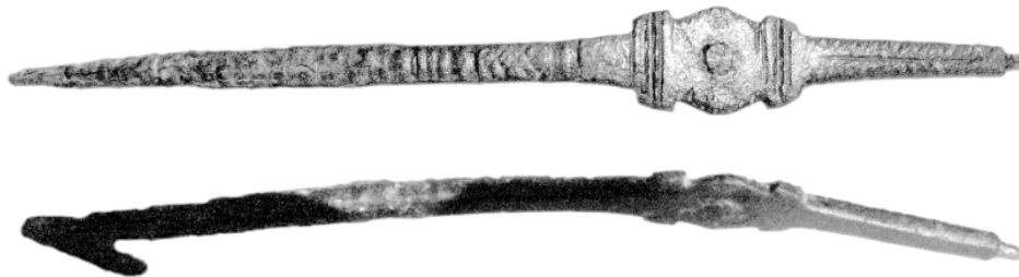
Рис. 1. Деталь застёжки воинского пояса, найденная вблизи места находки монетного клада у с. Репино. Длина 153 мм.

О времени начала дислокации в округе Херсонеса римских подразделений можно судить по датировке херсонесского декрета 173/174 г. в честь легата Кальпурниана и его супруги, прибывшим, как очевидно, вместе с подразделениями подчиненных легату войск [8, с. 58-86; 9].