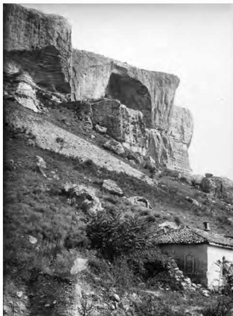
Рис. 1. Качи-Кальон, 1933 г.

Fig. 1. Kachi-Kal'on, 1933.