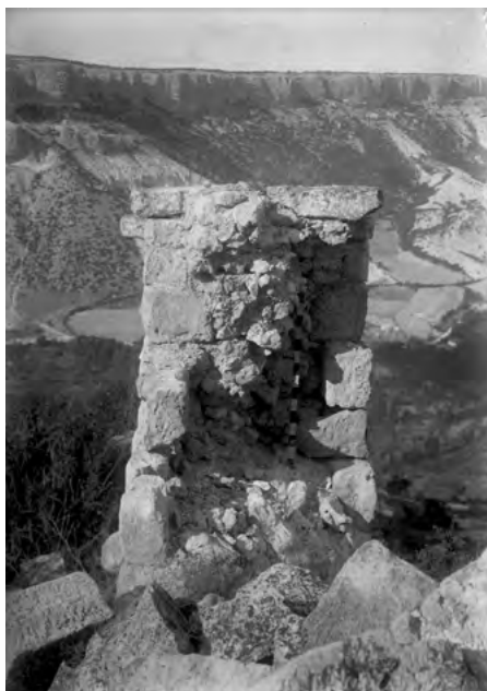
Рис. 3. Остатки башни в западном конце оборонительной стены, 1930 г.

Fig. 3. Remains of a tower in the western end of the defensive wall, 1930