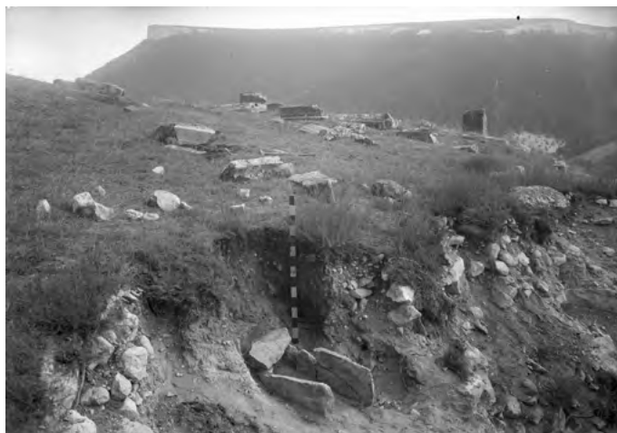
Рис. 4. Средневековое кладбище на поляне перед четвертым гротом Качи-Кальона, 1930 г.

Fig. 3. Remains of a tower in the western end of the defensive wall, 1930