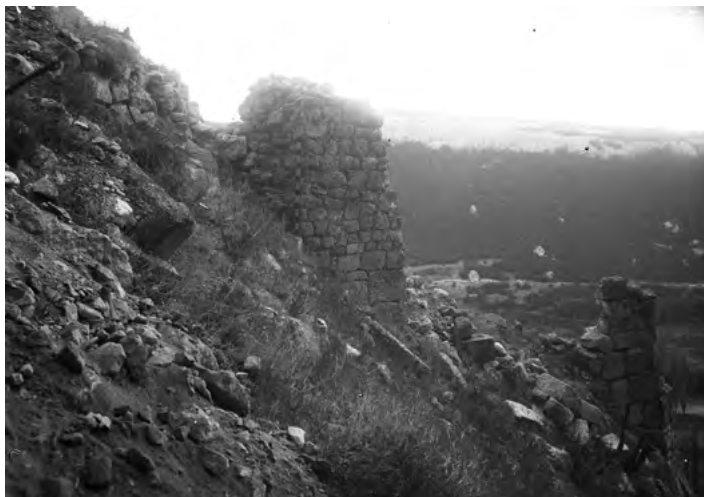
Рис. 2. Остатки оборонительной стены перед четвертым гротом Качи-Кальона, 1930 г.

Fig. 1. Kachi-Kal'on, 1933.