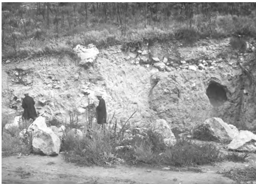
Рис. 6. Осмотр среза культурного слоя Качи-Кальона, 1933 г.