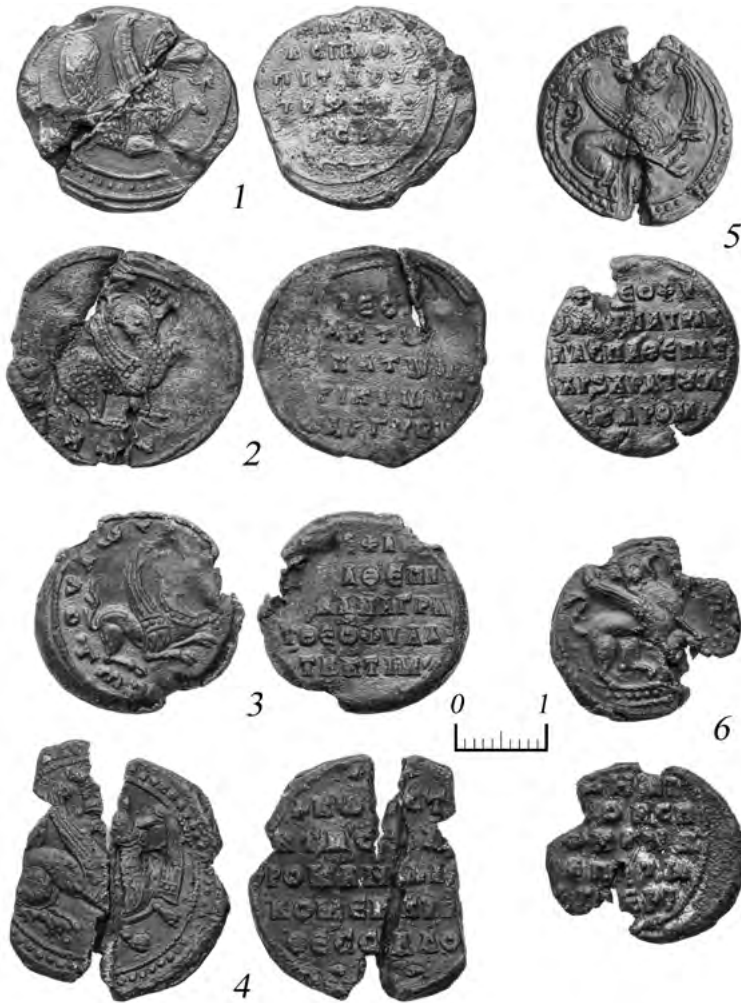
Рис. 1. Печати X в. из Государственного Эрмитажа: 1 – Печать императорского протоспафария, ἐπὶ τοῦ Χρυσοτρικλίνου и стратига Самоса; 2 – Печать Феофилакта Аргири, ипата и патрикия; 3 – Печать Стефана, протоспафария, επισκεптита и анаграфевса богохранимых императорских поместий; 4 – Печать Константина, императорского спафарокандидата и коммеркиария Фессалоники; 5 – Печать Феофилакта, патрикия, императорского протоспафария, ἐπὶ τοῦ Χρυσοτρικλίνου и хартулария дрoма; 6 – Печать Димитрия, императорского спафарокандидата и ἐπὶ τῆς μεγάλης ἐταιρείας.