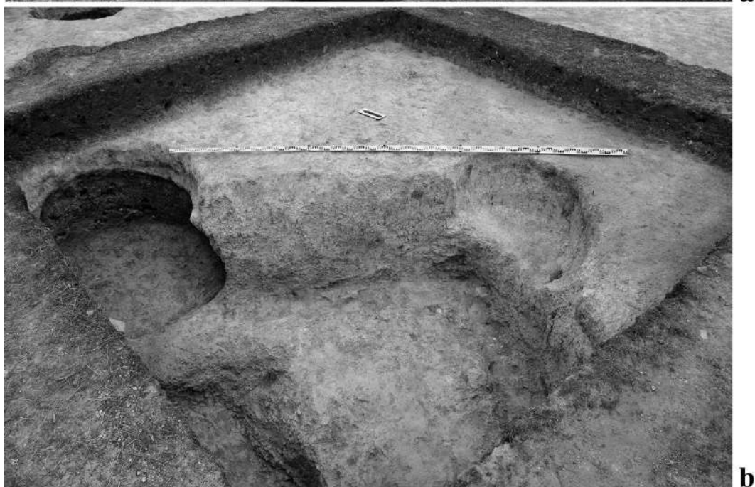
Рис. 2. Поселение Тобен-Сарай. Квадрат 3. Общий вид с юго-запада: а – после выемки заполнения помещения 1; б – финал