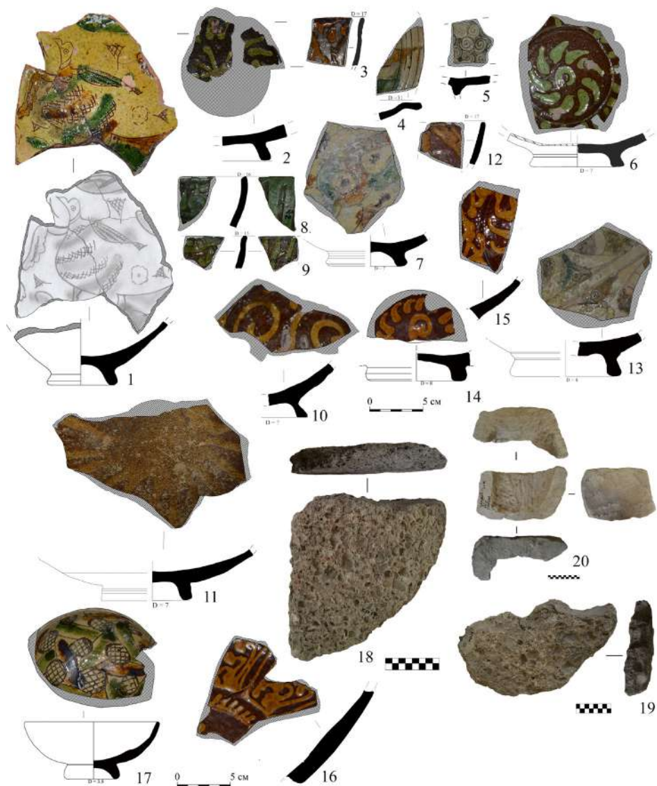
Рис. 5. Находки из раскопок поселения Тобен-Сарай. Фрагменты глазурованных сосудов. Квадрат 4: 1 – яма 3; штык 1: 2 – к.о. 5; 5 – к.о. 6. Квадрат 3: серый золистый слой: 3 – к.о. 9; 6 – к.о. 10; 4 – штык 3, желто-коричневый слой, п.о. 393; 7 – серый слой, к.о. 13. Квадрат 5: 8 – серый слой в юго-западной части квадрата, п.о. 372; 9 – темно-серый слой с углями в северо-западном углу, п.о. 296; 10 – светло-коричневый слой в юго-восточной части, п.о. 406; 11 – штык 3, красно-коричневый слой, к.о. 21. Квадрат 6, серый слой, штык 4: 12 – п.о. 420; 13 – к.о. 18; 14-15 – п.о. 420. 16 – Квадрат 7, яма 8, к.о. 12. 17 – Квадрат 8, штык 2, к.о. 8. Квадрат 5, серый слой в юго-западной части квадрата: 18-19 – фрагменты каменного жернова, к.о. 17; 20 – фрагмент каменного изделия неясного назначения, к.о. 16 (рисунки Д. Э. Сейдалиевой)