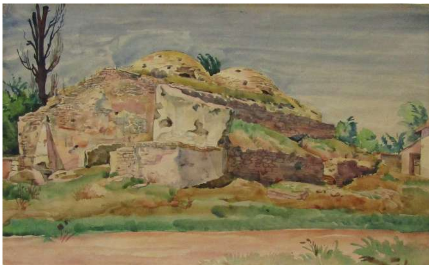
Рис. 1. Богаевский К. Ф. Старые татарские бани в Карасубазаре. 1925 г. Бумага, акварель. 31x50,5. Симферопольский художественный музей, КП № 267, инв. № Г 157