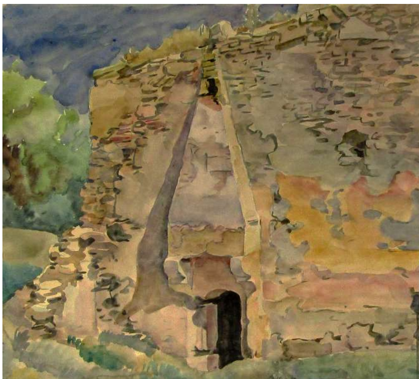
Рис. 2. Богаевский К. Ф. Вход в старые бани в Карасубазаре. 1920-е. Бумага, акварель. 33,9x37,8. ФКГА, инв. № РГ 508