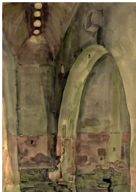
Рис. 9. Богаевский К. Ф. Вид Карасубазарских бань. Боковая ниша. 1920-е. Бумага, акварель. 50,2x33,6. ФКГА, инв. № РГ 521