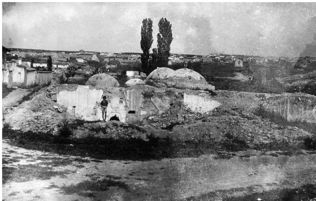
Рис. 13. Карасубазар. Бани. Внешний вид. Фото 1926 г. [по: 2, с. 482, рис. 480]