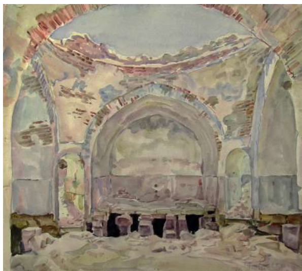
Рис. 7. Богаевский К. Ф. Развалины старых Карасубазарских бань. 1926 г. Бумага, акварель. 42,4x47,5. ФКГА, инв. № РГ 434