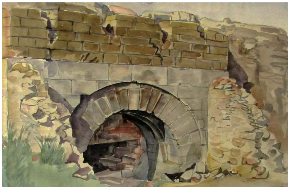
Рис. 3. Богаевский К. Ф. Старые татарские бани в Карасубазаре. Руины с аркой. 1920-е. Бумага, акварель. 31x48,1. ФКГА, инв. № РГ 520