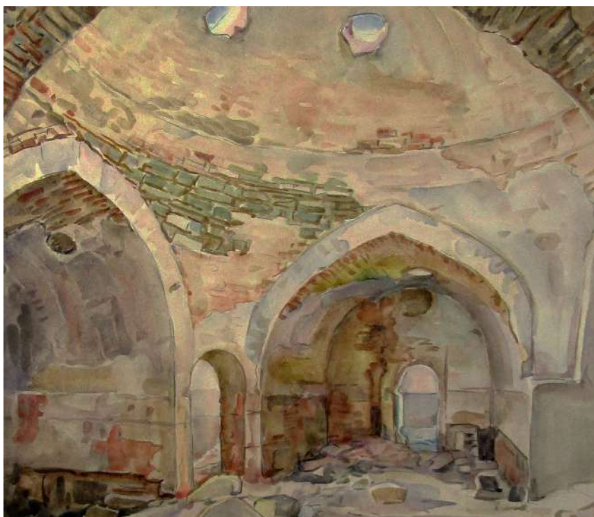
Рис. 6. Богаевский К. Ф. Внутренний вид старых карасубазарских бань. Свод и две ниши. 1920-е. Бумага, акварель. 42,1x47,2. ФКГА, инв. № РГ 510