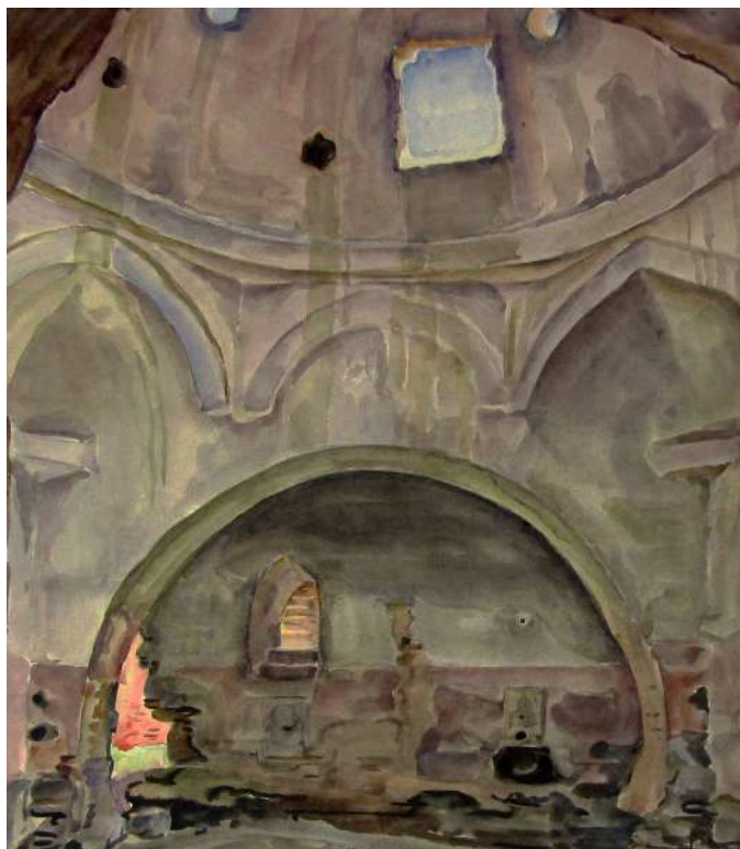
Рис. 11. Богаевский К. Ф. Свод и ниша в старых банях Карасубазара. 1920-е. Бумага, акварель. 47,4x42,5. ФКГА, инв. № РГ 509