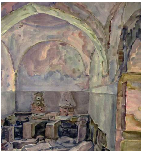
Рис. 8. Богаевский К. Ф. Интерьер старых Карасубазарских бань. 1920-е. Бумага, акварель. 37,6x40,9. ФКГА, инв. № РГ 513