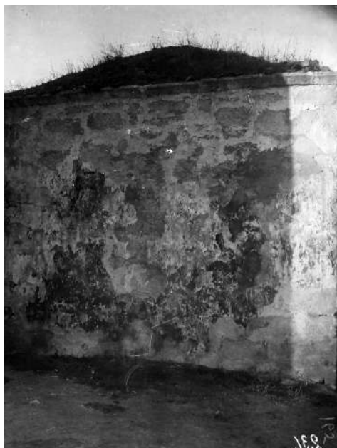
Рис. 17. Карасубазар. Бани Гёк-хаммам. Внешняя часть. Фото 1926 г. [по: 3, с. 144, рис. 706]