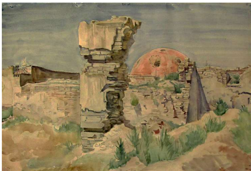
Рис. 4. Богаевский К. Ф. Руины карасубазарских бань с розовым куполом. 1920-е. Бумага, акварель. 33,9x50,1. ФКГА, инв. № РГ 516