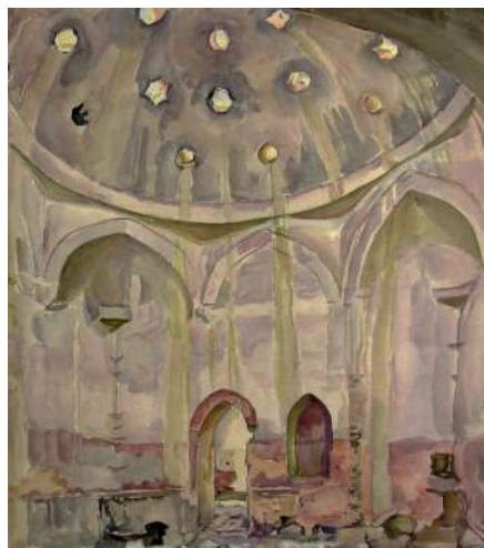
Рис. 10. Богаевский К. Ф. Внутренний вид Карасубазарских бань с частью купола и тремя нишами. 1920-е. Бумага, акварель. 47,6x41,5. ФКГА, инв. № РГ 525