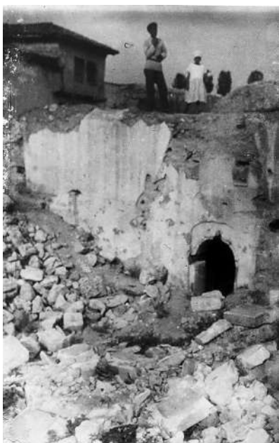
Рис. 15. Карасубазар. Вход в бани Биюк-хаммам. Фото 1926 г. [по: 2, с. 485, рис. 483]