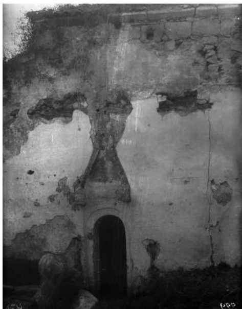
Рис. 18. Карасубазар. Бани Гёк-хаммам. Внутренняя часть. Фото 1926 г. [по: 3, с. 145, рис. 707]