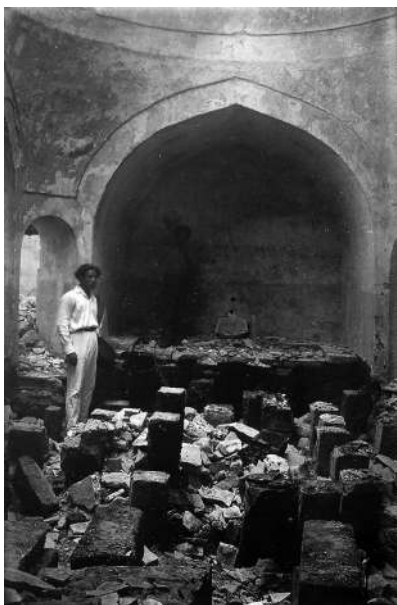
Рис. 16. Карасубазар. Бани Биюк-хаммам. Внутренний вид. Фото 1926 г. [по: 2, с. 481, рис. 479]