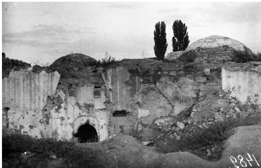
Рис. 14. Карасубазар. Бани Биюк-хаммам. Южный фасад. Фото 1928 г. [по: 3, с. 95, рис. 657]