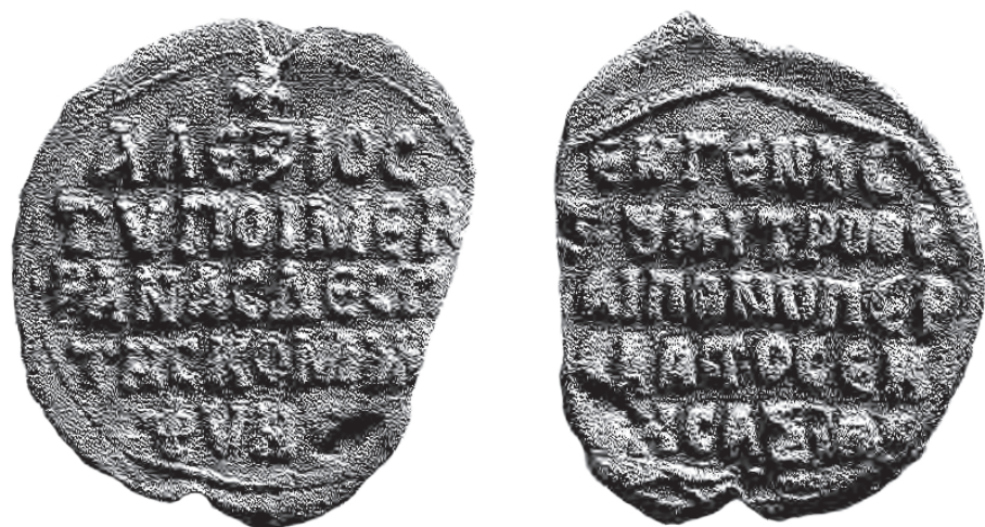
Рис. 2. Моливдовул паниперсеваста Алексея Враны из Софийского Национального археологического музея [по: 20, nr. 121].