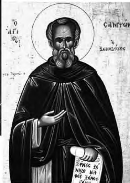
Рис. 4. Святой Сампсон.