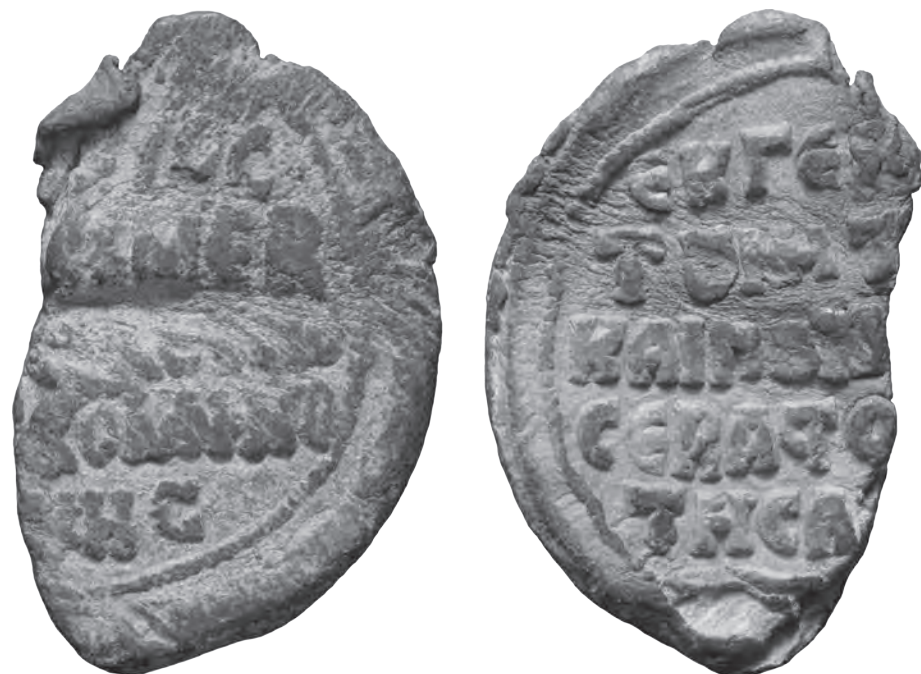
Рис. 1. Моливдовул паниперсеваста Алексея Враны из византийского Херсона (частная коллекция, Москва).