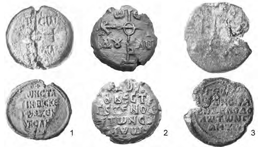
Рис. 3. Ксенодохи Святого Сампсона.

1 – Константин, императорский скевофилак (середина IX в.), 2 – Мануил (?), императорский веститор (первая половина IX в.), 3 – Георгий, протонотарий (IX/X в.).