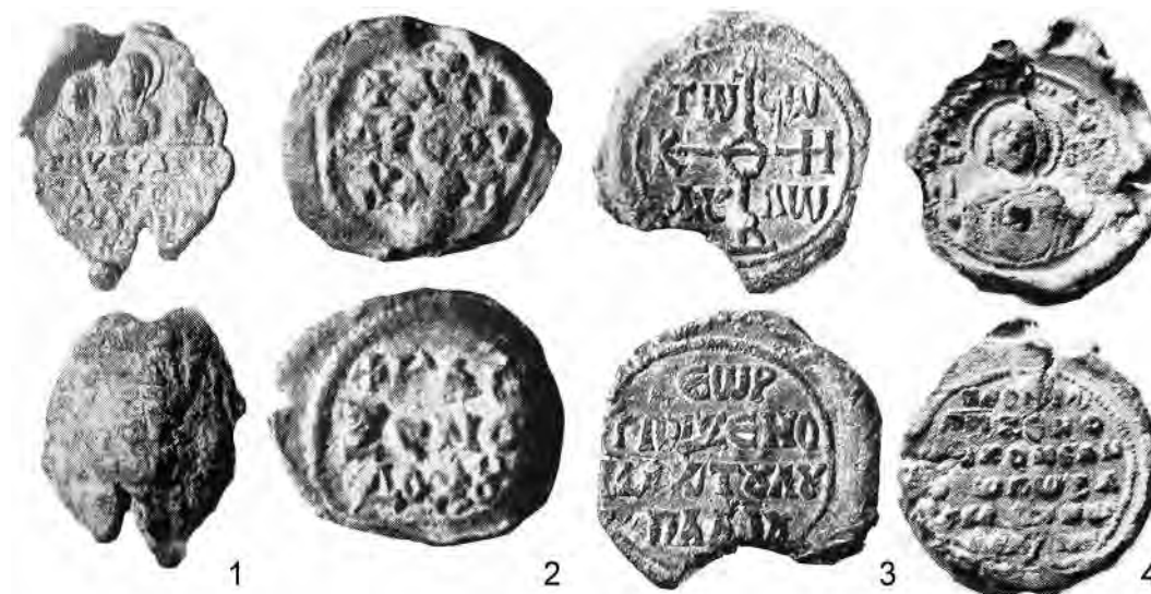
Рис. 1. Ксеноны и ксенодохи.

Keywords: Byzantium, seal, Xenon of Saint Sampson, philanthropy.